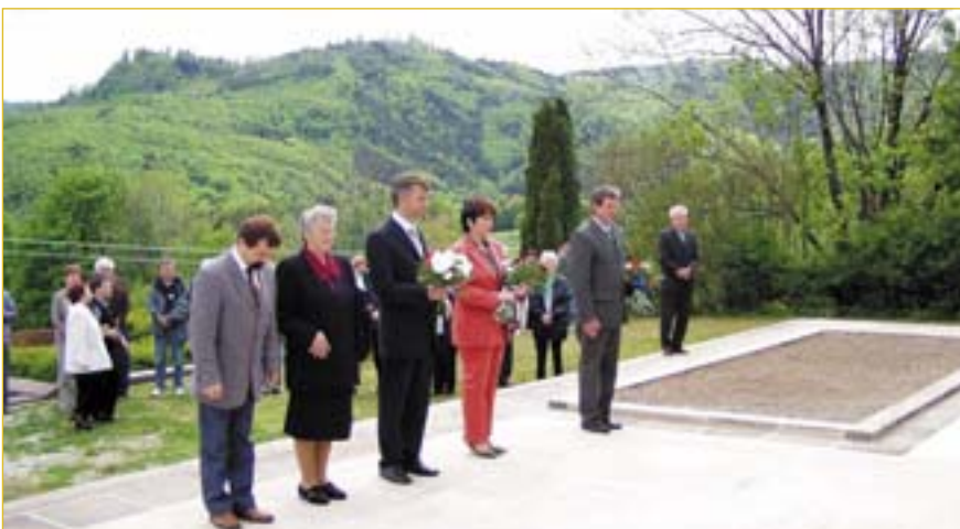
Součástí návštěvy bylo uctění památky obětí II. světové války

Doufáme, že naše přátele ze Slovenska budeme moci co nejdříve přivítat v Napajedlech. J. Souček