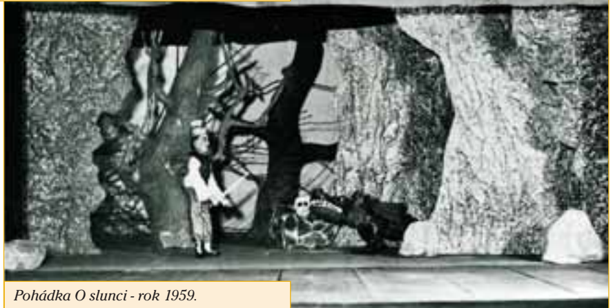
Pohádka O slunci - rok 1959.

V roce 1948 však vznikl nový loutkový soubor při n. p. Fatra, který způsobil personální problémy stávajícímu souboru na sokolovně. Přesto původní soubor přes veškeré potíže funguje až do roku 1952, i když jeho činnost není již tak bohatá (asi 4–7 představení ročně). V tomto roce však část členů v čele s režisérem Rozenzweigem odchází do loutkového souboru Fatra. Původní soubor stagnuje, ale