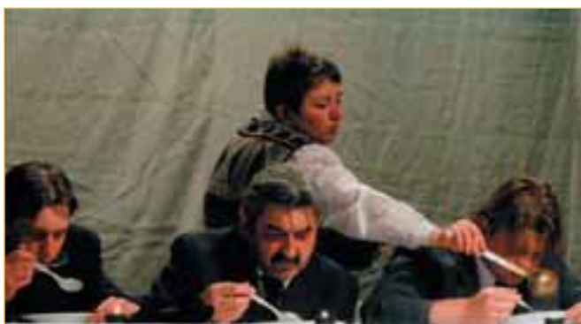
Divadelníci z Karolinky byli hostem festivalu již poosmé. Letos si stejně jako v roce 1996 odvezli nejvyšší ocenění.