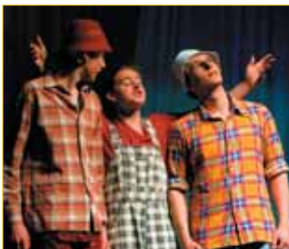
Na studenty ze Vsetína se festivalové publikum povětšinou těší. I letos pojali klasika po svém a mile překvapili.