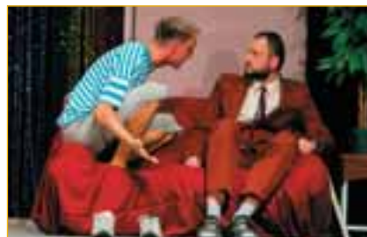
NAKOP tyjatr z Jihlavy sliboval veselý večer už volbou autora - A. Procházka: Fatální bratři.

● Diváci udělili svou cenu za příjemně prožitý večer výslednou známkou 4,7633 Divadlu Dostavník Přerov za inscenaci Malováno na skle.