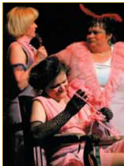
Soubor z Moravských Budějovic zavedl diváky do nevěstince z dob dávno minulých s nevěstkami, které už také hodně pamatují.