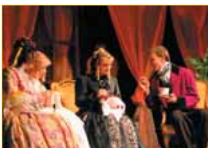
Domácí soubor Zdeňka Štěpánka nabídl salonní hru A. Fredra Magnetismus srdce.