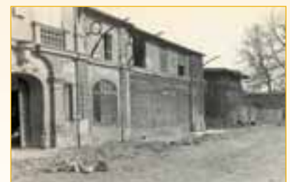
Nový závodní klub vyrostl na místě starého skleníku, správní budova a další klubovny spolu s loutkovým sálem z vedlejšího hospodářského stavení.

ji soubory ZK ROH Fatra-Slavia, Osvětová beseda Slušovice, ZK ROH Svit Zlín a ZK ROH Svit Otrokovice. Na přehlídce měl největší úspěch slušovický soubor, který před diváky vystoupil s hrou Ilji Prachaře Hádají sa o rozumné. V uvedeném přehlídce byl zřejmě počátek dnešních divadelních festivalů.