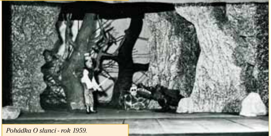
Pohádka O slunci - rok 1959.