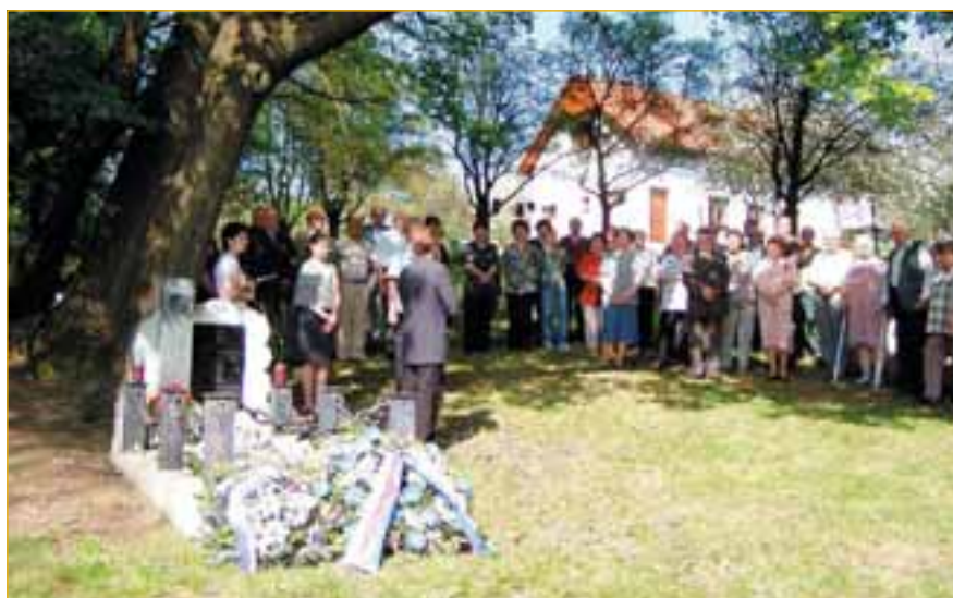
Celý svět si na začátku května připomněl, že od druhé světové války uplynulo šedesát let. Napajedla se dočkala osvobození 2. května 1945 a v tento den vzdala čest všem padlým spoluobčanům a osvoboditelům města. (Více na str. 3, foto J. Souček)