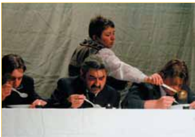
Divadelníci z Karolinky byli hostem festivalu již poosmé. Letos si stejně jako v roce 1996 odvezli nejvyšší ocenění.