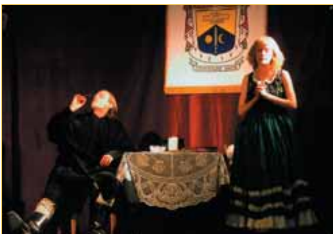
OSDO z Ústí nad Orlicí po dvou letech opět sáhlo do repertoáru P. Claudela, tentokrát Rukojmí.