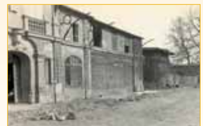
Nový závodní klub vyrostl na místě starého skleníku, správní budova a další klubovny spolu s loutkovým sálem z vedlejšího hospodářského stavení.

ji soubory ZK ROH Fatra-Slavia, Osvětová beseda Slušovice, ZK ROH Svit Zlín a ZK ROH Svit Otrokovice. Na přehlídce měl největší úspěch slušovický soubor, který před diváky vystoupil s hrou Ilji Prachaře Hádají sa o rozumně. V uvedeném přehlídce byl zřejmě počátek dnešních divadelních festivalů.