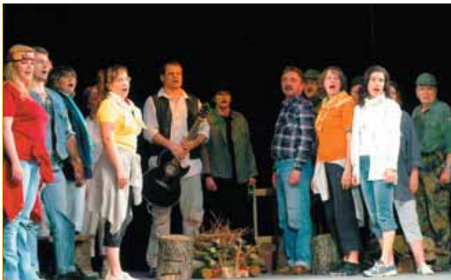
Dostavník Přerov - Malováno na skle.