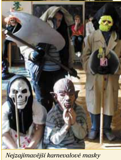
Nejzajímavější karnevalové masky