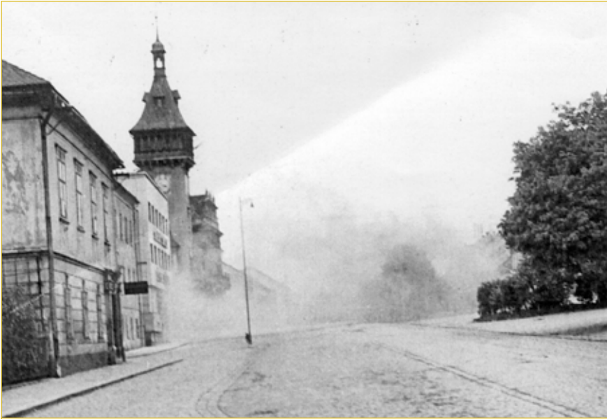
2. květen 1945 - 15,00 hod.