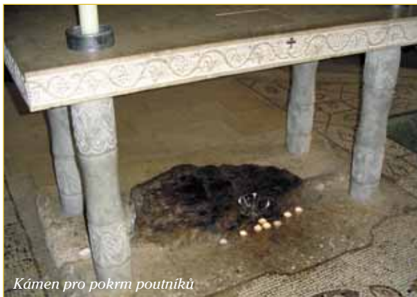
Kámen pro pokrm poutníků