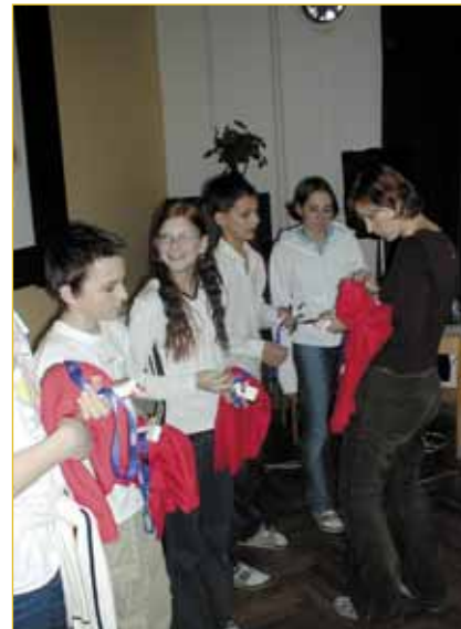
Blahopřání pro vítěze.