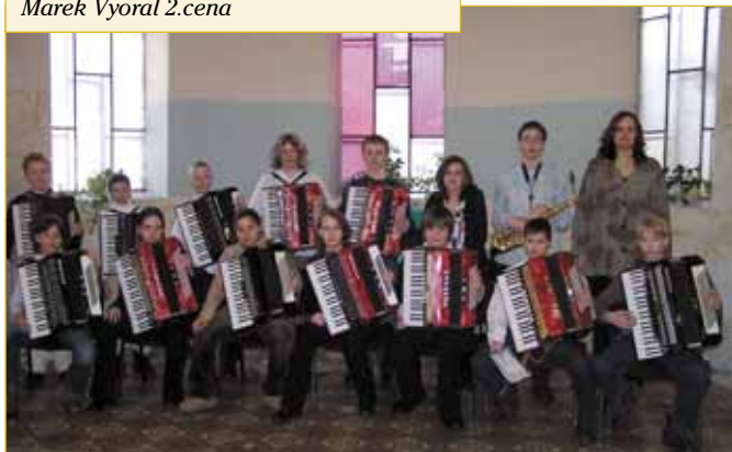
Akordeonový soubor -starší žáci postup do krajského kola, 1.cena