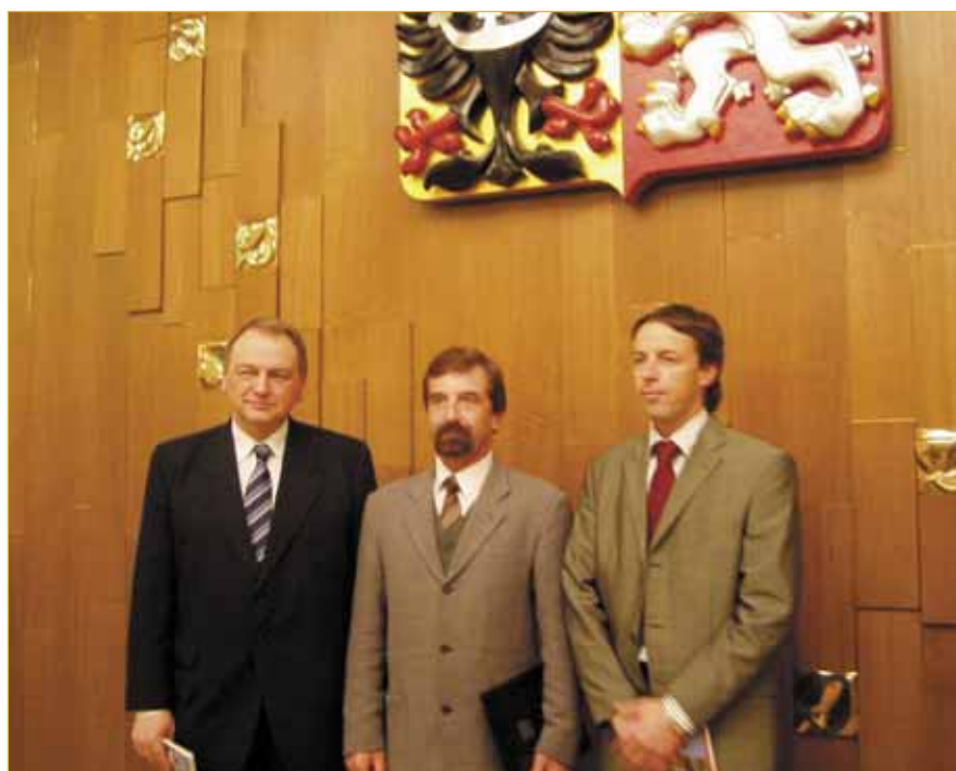
Starosta města při převzetí dekretu o právech užívat symboly města.