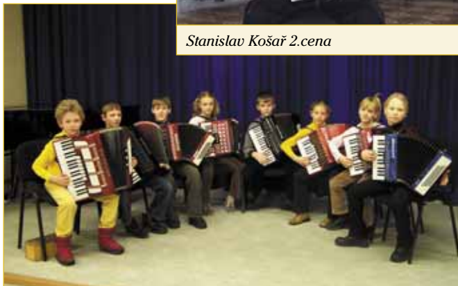
Akordeonový soubor -mladší žáci 2.cena