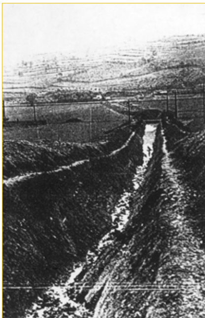
Protitankový zákop na jihu města - konec dubna 1945.

O výsledku války bylo rozhodnuto již počátkem roku 1945. Přesto hitlerovská armáda byla odhodlána k nesmyslnému odporu a snažila se za každou cenu zdržet co nejdéle postup vítězných armád. V měsíci dubnu postoupila Rudá armáda k jižní hranici Moravy, na severu probíhaly těžké boje ve Slezsku. Československý armádní sbor generála Svobody se probíjel Slovenskem ve směru na moravské Beskydy. Obyvatelé Napajedel se dovídali různé často i zkreslené zprávy o probíhajících a nepříjemných událostech při přechodu fronty. V mezích svých možností se připravovali na možné boje zatloukáním oken, budováním provizorních krytů, sháněním základních potravin pro nepředvídané události apod.