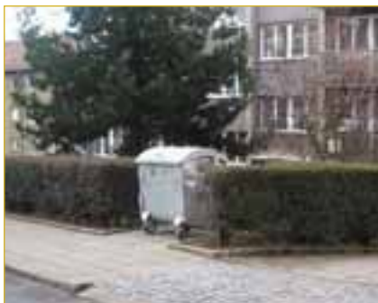
Kontejner v Komenského ulici, místo zásahu hasičů o silvestrovské noci.