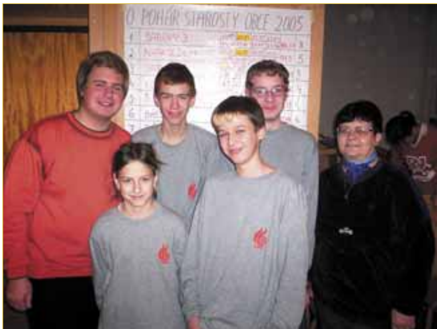
Družstvo napajedelských mladých hasičů před výsledkovou listinou