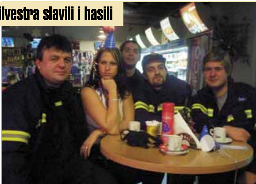
Členové JSDHM při krátké zastávce na kávu u benzinové čerpací stanice.