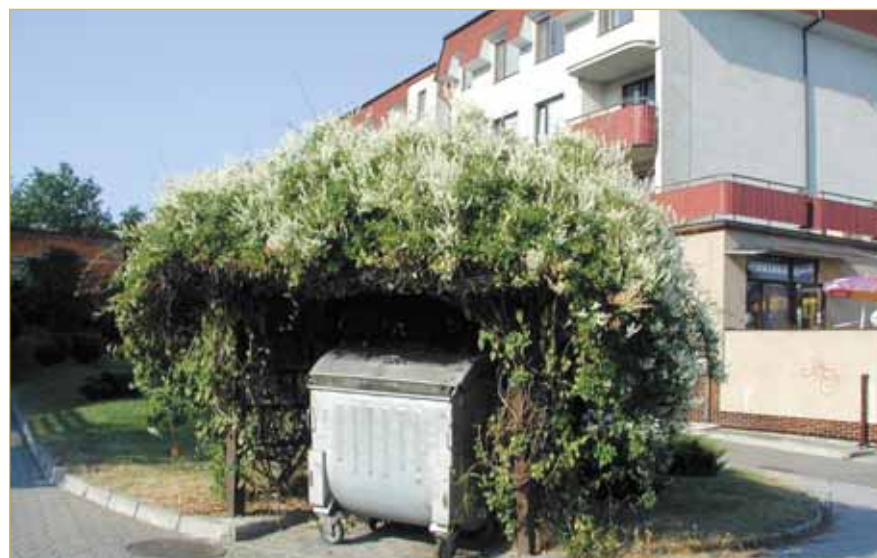
Popelnice jsou nezbytnou součástí městských ulic, ale nemusí být vždy nevábým a zapáchajícím místem. Takové květinové obydlí mají popelnice v Komenského ulici.

Uzávěrka příštího vydání novin je 9. října 2004