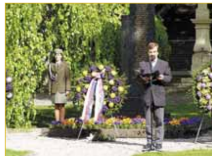
Pietní vzpomínka na osvobození Napajedle se tradičně koná u památníku na Kalvárii a na Masarykově náměstí.