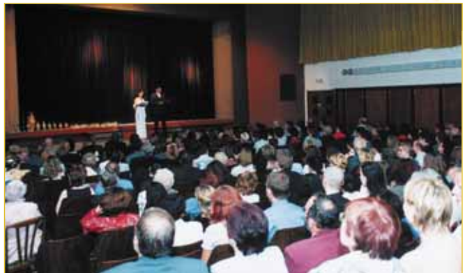
Poslední festivalový den stálo na forbině seřazeno váz jako ve slušně zavedeném obchodu se sklem a keramikou. Chvilka napětí - a za uznalého potlesku diváků každá z nich měla brzy svého šťastného majitele. Kromě herců si podobně ceny odnesli i šťastní výherci z losování předplatenek.