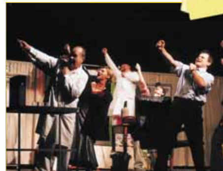
Den čtvrtý - úterý 27. dubna. To neřeš! aneb stará zaví. Dostavník je stálící napajedelského festivalu vždycky mohli diváci spolehnout byly dobré písničky pěvecké výkony. Jednou dole, jindy nahoře - jiná tak dlouholetého účastníka festivalu být nemůže. přerovští skvěle vyhověli náladě diváků. Ač v To neřeš! bylo psáno, že život není peříčko, ale pro kra těžká traverza, přesto - či spíše proto? - je rozesmáli. A do hlasovací urny ve vestibulu diva pětky ostošest.