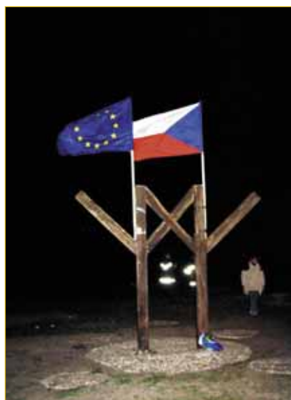
Někde halasně, někde bez zájmu vítali lidé vstup Česka do Evropské unie. V Napajedlích jsme zůstali někde uprostřed. Pár lidí se sešlo u symbolu přátelství na Makové, postáli spolu kolem ohně a kdovi, na co kdo právě myslel. Snad že je zatím pramálo důvodů k oslavě a mnohem víc k práci.

Mimořádné číslo Napajedelských novin vyjde začátkem června u příležitosti voleb do Evropského parlamentu.