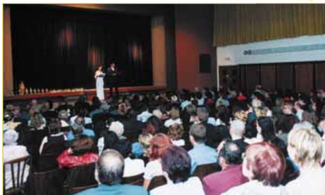
Poslední festivalový den stálo na forbině seřazeno váz jako ve slušně zavedeném obchodu se sklem a keramikou. Chvilka napětí - a za uznalého potlesku diváků každá z nich měla brzy svého šťastného majitele. Kromě herců si podobně ceny odnesli i šťastní výherci z losování předplatenek.