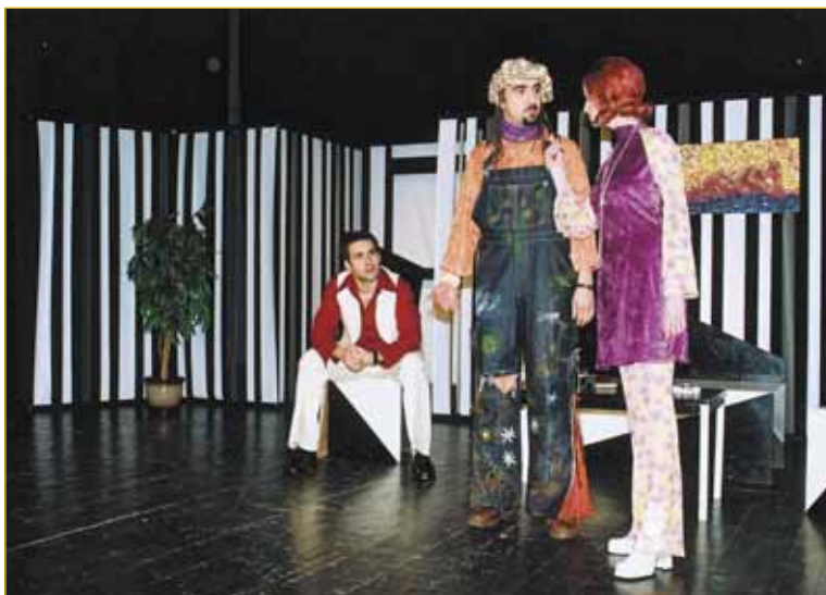
Den sedmý - pátek 30. dubna, den udílení cen a nesoutěžního představení. Po slavnostním ceremoniálu čekala na diváky Past, detektivka v podání vsetínského souboru IPSEN, Iniciativních Pedagogů S Extrémním Nadšením z Masarykova gymnázia ze Vsetína, jehož studentský soubor jsme v Napajedlích vidali v předcházejících letech. Divák znalý krimi zápletky z filmu Past na Alfreda Hitchcocka se mohl bez napětí nechat unášet scénou a výpravou z šedesátých let.