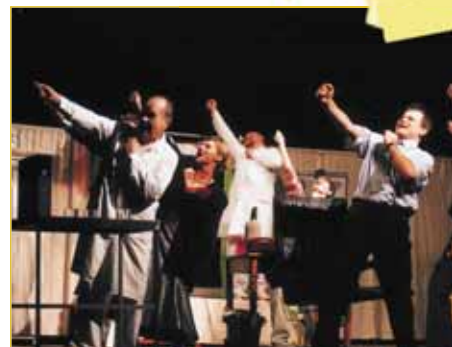
Den čtvrtý - úterý 27. dubna. To neřeš! aneb stará zaví. Dostavník je stálící napajedelského festivalu vždycky mohli diváci spolehnout byly dobré písničky pěvecké výkony. Jednou dole, jindy nahoře - jiná tak dlouholetého účastníka festivalu být nemůže. přerovští skvěle vyhověli náladě diváků. Ač v po To neřeš! bylo psáno, že život není peříčko, ale p kra těžká traverza, přesto - či spíše proto? - je rozesmáli. A do hlasovací urny ve vestibulu diva pětky ostošest.