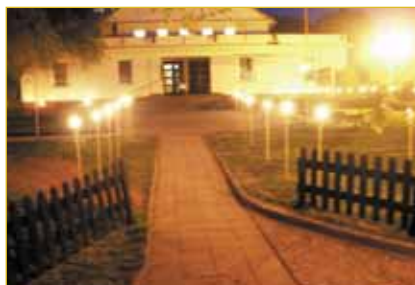
Pochodňový špalír do Klubu kultury při premiéře hry Tančící myši

Literárně-dramatický obor bude otevřen v naší škole poprvé. Děti budou rozděleny do skupin podle věku, vyučování se bude konat ve dvouhodinových lekcích jednou za týden.