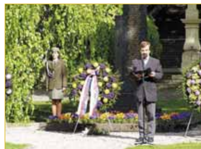
Pietní vzpomínka na osvobození Napajedle se tradičně koná u památníku na Kalvárii a na Masarykově náměstí.