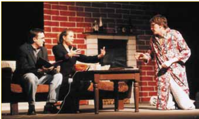
Den pátý - středa 28. dubna. Malá scéna Zlín inscenací Woody, Woody, přinesla na jeviště specifický humor Woody Allena. Komedie o milostných vzplanutích mladého filmového kritika na motivy hry Zahraj to znovu, Same přinesla představiteli hlavní mužské role čestné uznání poroty.

...áška nere- ...a na co se ...ky a dobré ...k to ani u ...Tentokrát ...dtitulu hry ...orchestr- ...pobavili a ...dla padaly