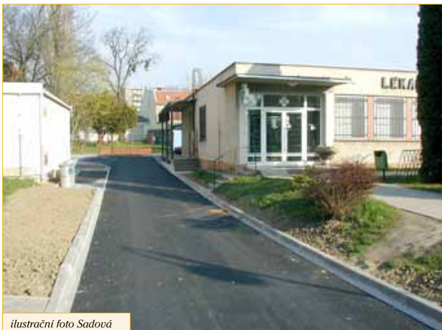
ilustrační foto Sadová

Záměr, aby se Zlínský kraj stal společně s Univerzitou Tomáše Bati spoluzakladatelem výzkumného centra, schválili krajští radní. Účast kraje při založení centra by byla jedním z konkrétních kroků, které plynou z dohody o spolupráci uzavřené mezi Zlínským krajem a univerzitou. Samotné centrum by přispělo především k rozvoji podnikání, ke snížení růstu nezaměstnanosti a zvýšení vzdělanosti v regionu.