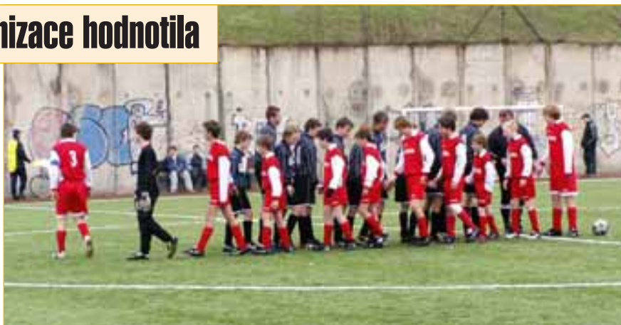
Na novém fotbalovém hřišti ve sportovním areálu škol zahájila jarní část soutěží žákovská družstva.

Nejdůležitější je však skutečnost, že zmíněných 762 lidí dává přednost aktivnímu sportu a tělovýchově a na sportovních soutěžích dělá Napajedlům dobré jméno. Z tohoto pohledu jsou sportovci zklamáni, že zastupitelé města nenašli dostatek odvahy a vůle k tomu, aby ve sportovním areálu u základní školy vyrůstala tolik potřebná a očekávaná sportovní hala. Uvážíme-li, že se sportu v našem městě věnuje