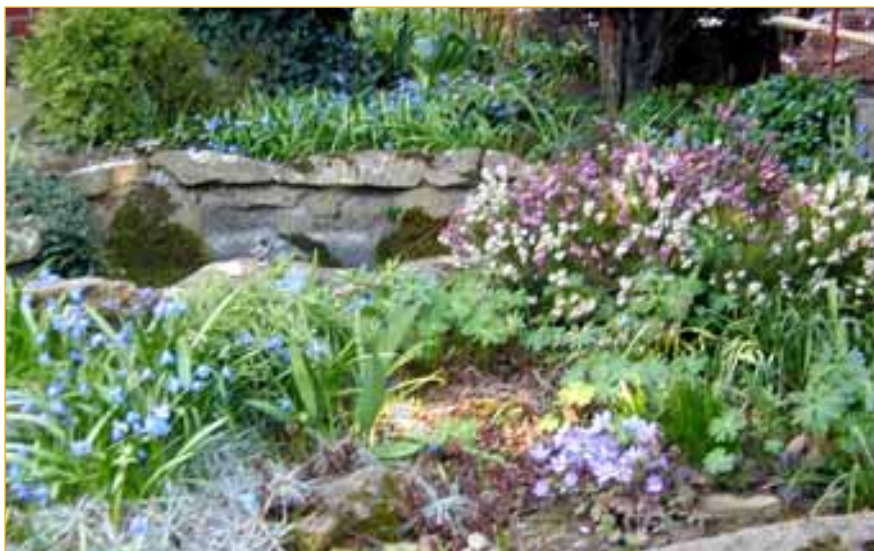
Soutěž o nejhezčí rozkvetlý balkon a okno, o nejhezčí okrasnou zahrádku či okrasnou zeleň okolo firemních objektů vyhlásují pro letošní léto Napajedla. Čtěte uvnitř listu. -red-