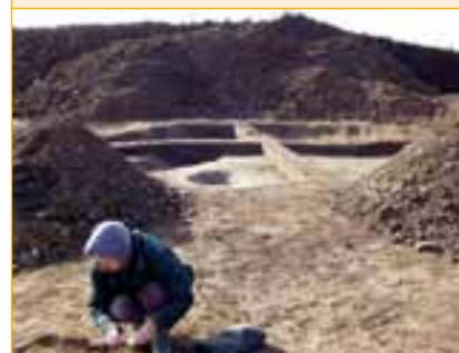
Nejzajímavější nálezy z vykopávek již byly vystaveny ve Zlíně, část souboru spolu s nejnovějšími objevy spatří veřejnost na výstavě v Napajedlích pod názvem „Dobré místo k žití - 7000 let“. Zahájení výstavy se plánuje na měsíc červen..