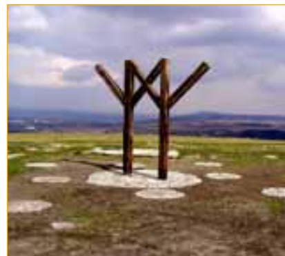
Socha přátelství na Makové.

Cyril Bureš, učitel z nové školy, kterému táhne na sedmdesátku.