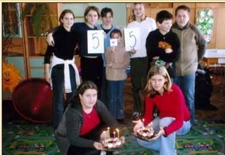
Jaké by to byly narozeniny bez dortu?