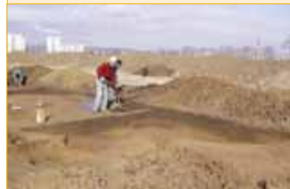
Archeologické nálezy v Malenovicích odhalily pod zemědělskou půdou, po které povede dálnice, pozůstatky lidského osídlení.