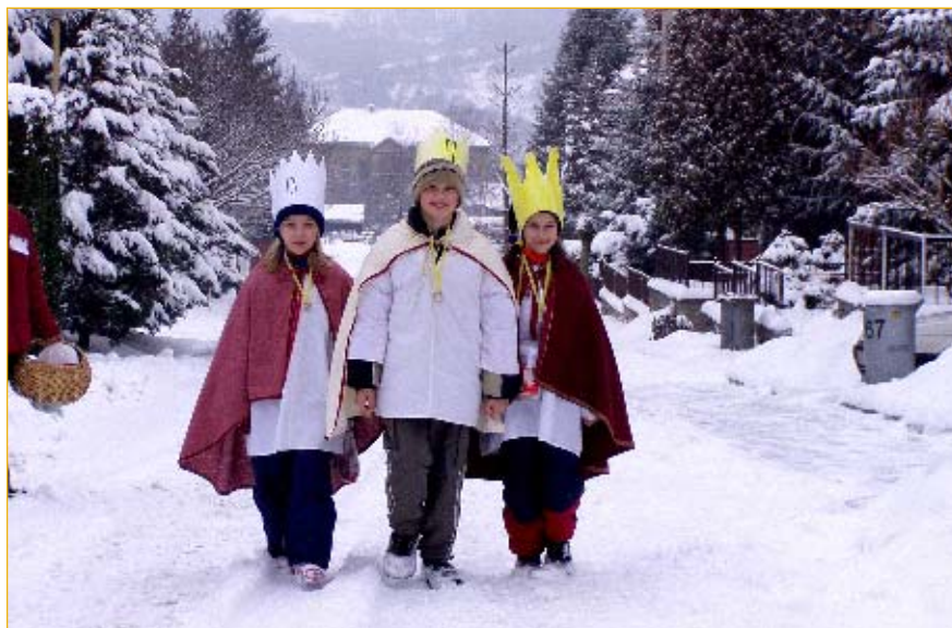
Cestičky ke všem domácnostem prošli v sobotu 10. ledna koledníci Tříkrálové sbírky. A sněhové nadělení pro ně bylo tou nejmenší překážkou.