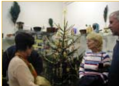
Výstava vyvolává sváteční vánoční náladu.