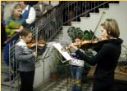
Žáci ZUŠ R. Firkušného.