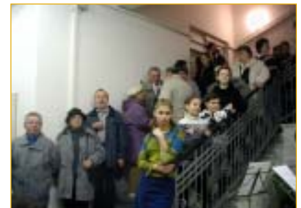
Návštěvníci vernisáže zaplnili vchod do Městského muzea do posledního místečka.