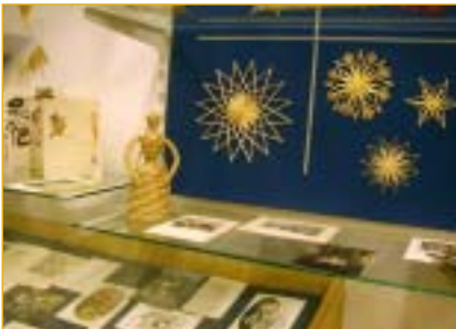
K vidění jsou i originální novoročenky.