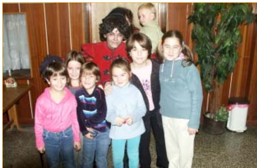
Divadlo Zd. Štěpánka nabídlo v neděli 16. listopadu reprízu příběhu nezbedného čerta Belínka. Do třetice potěšilo asi 150 diváků a spousta těch nejmenších neodolala příležitosti vyfotografovat se s "opravdickým" čertem."