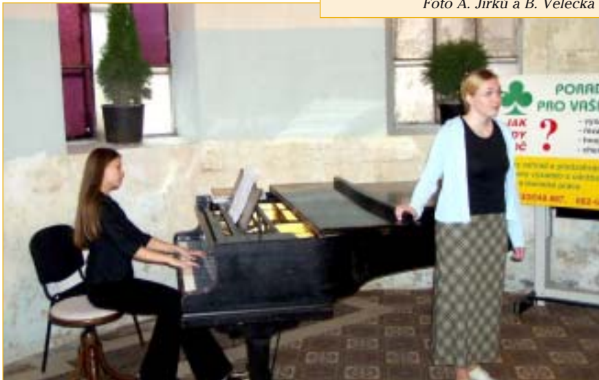
Slavnostní náladu setkání podpořili žáci kroměřížské konzervatoře.