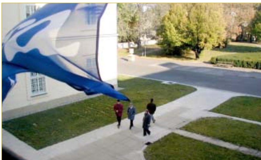
Sváteční den byl jako vymalovaný a zvědaví návštěvníci přicházeli k zámeckým branám ještě před otevírací hodinou.