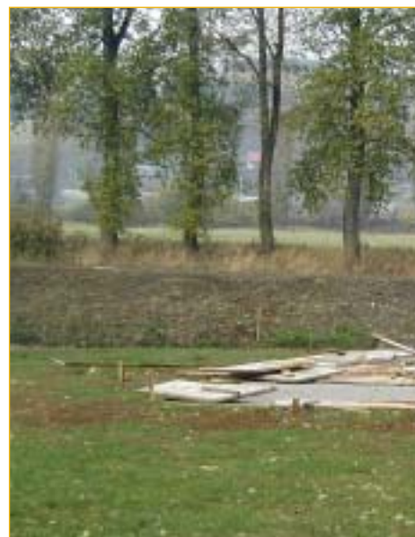
Nábřeží 27. října 2003. Bez komentáře.