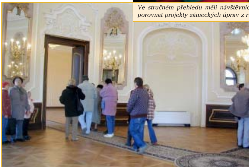
Nejeden z dopoledních návštěvníků zavítal po obědě do zámku ještě jednou.

poprvé v životě a nikdy netušili, při denní cestě kolem, co se za zdmi budovy skrývá. Někdo si možná ani neuvědomil, že se nachází v objektu, o který pečuje výrobní závod a očekával turistickou atrakci, ale všichni byli potěšeni tím, že se o objekt dobře pečuje.