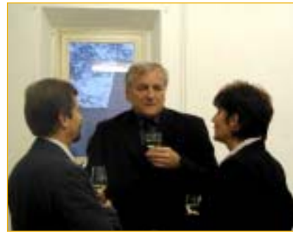
Otevřenost je v Napajedlích ta správná cesta do budoucna.

Pořádající Městské informační centrum Napajedla děkuje všem za ochotu a pochození.