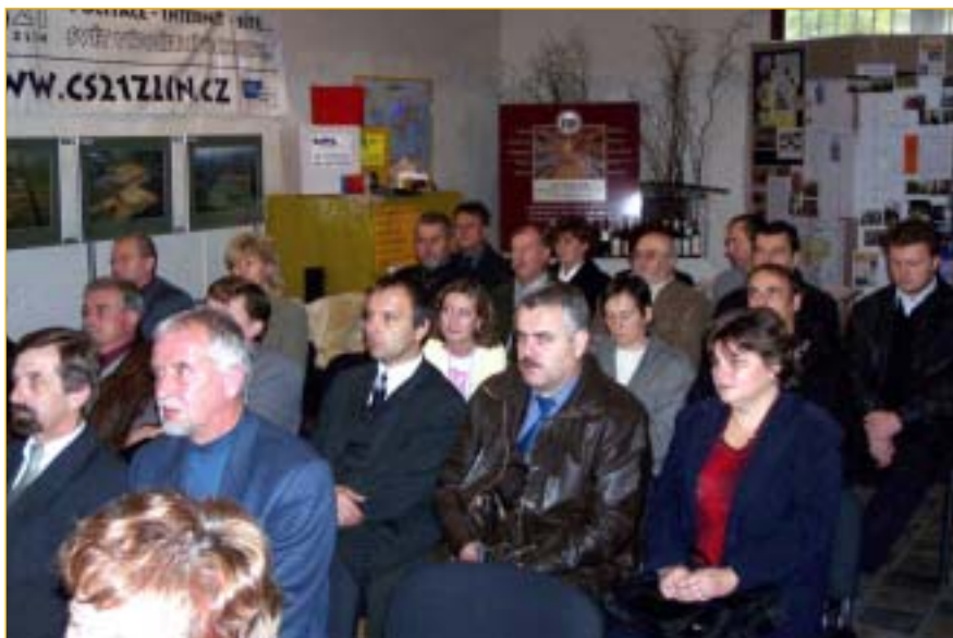
Zástupci města a firem se sešli na společném setkání.

lečností. Více než polovina oslovených se setkání zúčastnila, přítomni byli také členové městského zastupitelstva a zaměstnanci radnice. (pokračování na straně 4)