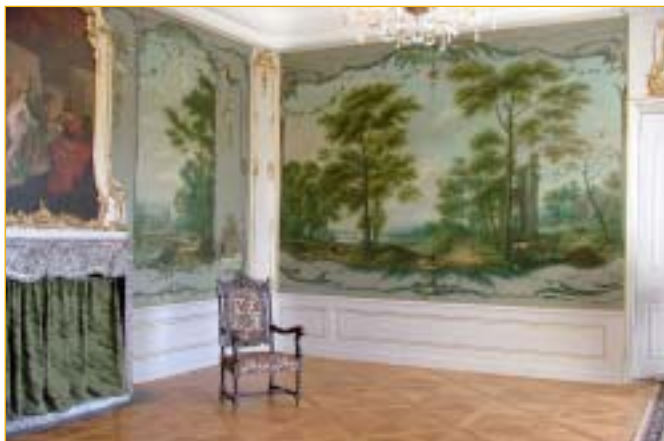
Najít chvíli, kdy byly komnaty zcela prázdné a dojem z prostředí nejsilnější, nebylo snadné.