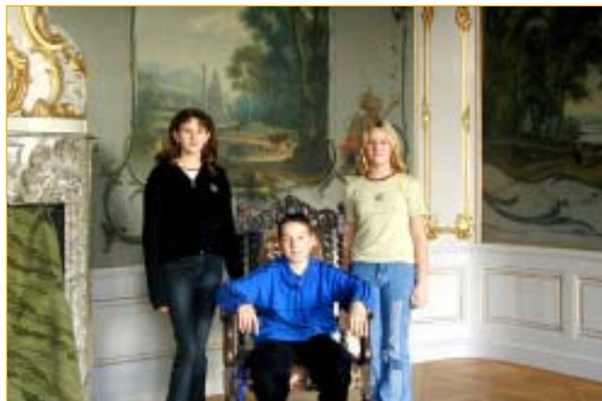
A na závěr společné foto na památku.