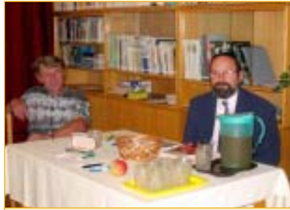
Pořadatelé a hostitelé - Je libo skleničku jablečného moštu?

Melrose je americká odrůda, která byla vyšlechtěna křížením odrůd Jonathan a Red Delicious. Sklízí se ve druhé polovině října, konzumně nazrává v lednu se skladovatelností až do dubna. Tato šťavnatá aromatická jablčka jsou ze zahrádky předsedy ovocnářské sekce napajedelských zahrádkářů.