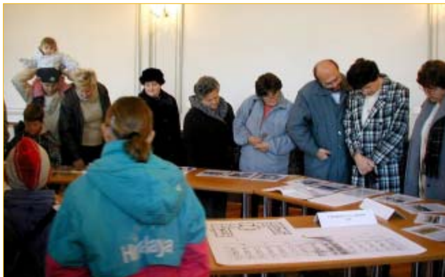
Ve stručném přehledu měli návštěvníci možnost oživit si znalosti z historie a také porovnat projekty zámeckých úprav z různých časových období.

Víceméně se dala očekávat přítomností lidí, kteří v zámku léta bydleli, v bytech nebo v ubytovnách učiliště, pamatovali si místa, kde měli postel, kde stál stůl na ping-pong i jaké měli tepláky při prvních tanečních. Milovníky tradice zajímalo v jakém stavu přežily interiéry slavnostních sálů, některé rodiny zvolily zámek za cíl podzimní procházky. Ti nejstarší ještě měli v živé paměti předválečné zařízení komnat, jiní zavítali do zámku