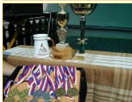
Stejně jako v prvním ročníku je odměnou pro hráče flaška a štangle salámu, ale poháry a medaile k němu patří stejně jako ke každému velkému sportovnímu klání.