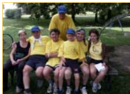
Zato výkon týmu KGB role favorita nijak neovlivnila a stal se potřetí vítězem turnaje.