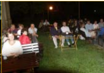
Mimořádně teplé léto večerům před klubem letos přálo. První se konal v polovině června, poslední v pátek 8. srpna. Dobrá muzika, oblíbený nápoj, vyvolená osoba po boku, přátelé kolem stolu - co ještě chybí k příjemnému posezení pod hvězdami?