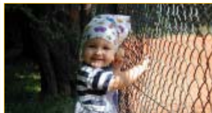
Podívejte, tam za plotem běhají za míčem i staří páni a je to fakt zábava.