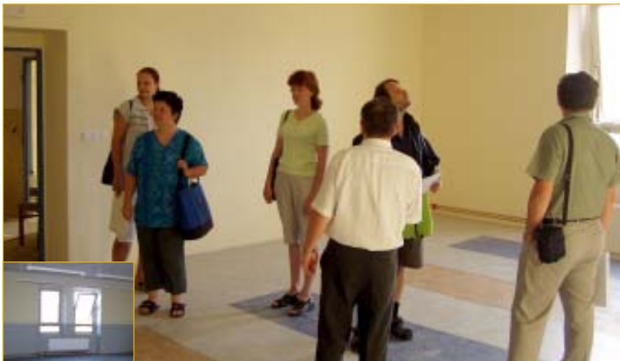
Jsou tři týdny do zahájení nového školního roku. V nových prostorách Základní umělecké školy R. Firkušného v Komenského ulici se koná pravidelný čtvrtletní kontrolní den. Učebny se prosvětlují, k nepoznání se mění zázemí školy. Práce pokračují svižným tempem, 18. srpna se začne stěhovat nábytek.