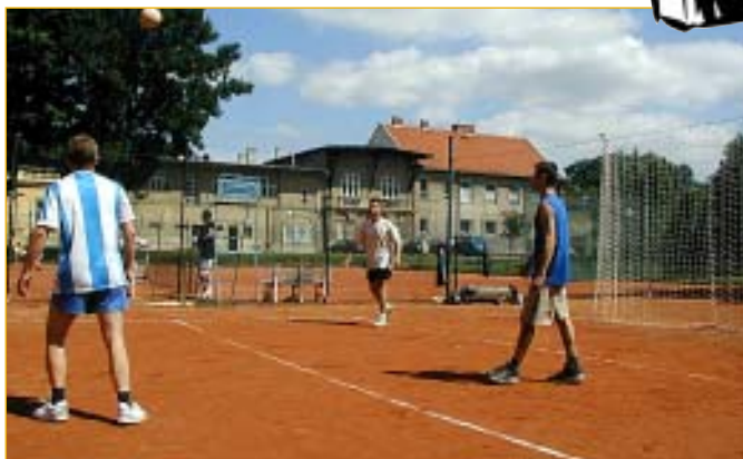
Výměnou rozpálených asfaltových ploch na Nábřeží za příjemné prostředí uprostřed parkové zeleně turnaj jenom získal.