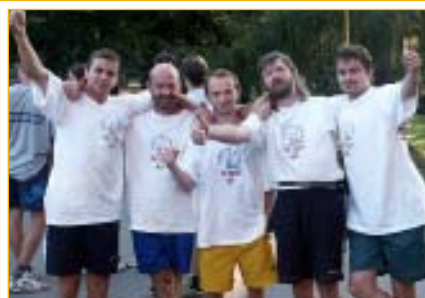
Po postupu ze skupiny se týmu Klubu kultury při prvním startu v turnaji asi malinko zatočila hlava a v dalších utkáních se jim už tolik nedařilo.