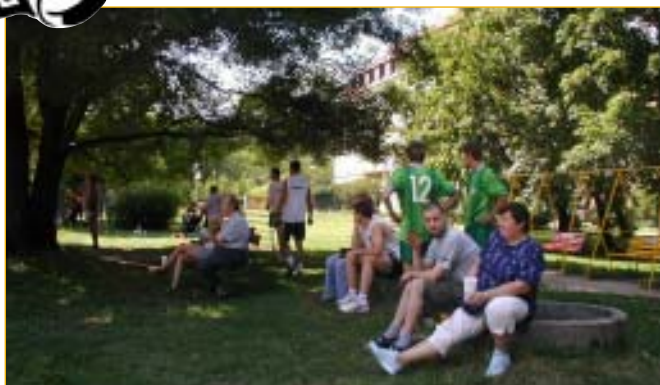
Nepřišel ani o své věrné diváky, kteří v některých případech nebyli zas až tak nezaujatí, ale vše se odbyvalo jen na úrovni slovních přestřelek.