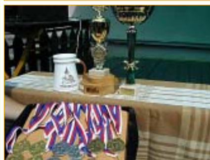
Stejně jako v prvním ročníku je odměnou pro hráče laňka a štangle salámu, ale poháry a medaile k němu patří stejně jako ke každému velkému sportovnímu klání.