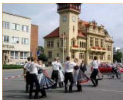
Každý druhý rok se scházejí ve Zlíně na mezinárodním festivalu „Besedování“ hudební skupiny a taneční soubory z různých zemí Evropy. V sobotu 5. července jsme jeden ze souborů mohli vidět i v Napajedlích. Více uvnitř listu.