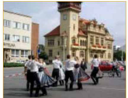
Každý druhý rok se scházejí ve Zlíně na mezinárodním festivalu „Besedování“ hudební skupiny a taneční soubory z různých zemí Evropy. V sobotu 5. července jsme jeden ze souborů mohli vidět i v Napajedlích. Více uvnitř listu.