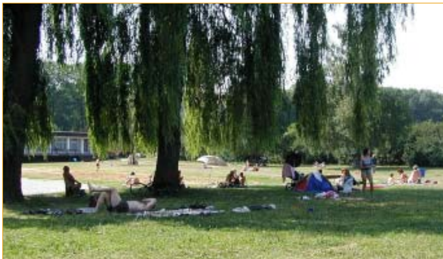
Báječný čas prázdnin a dovolených je tady. Přejeme všem čtenářům NN ať si je užijí podle svých představ a šťastně a odpočívání se vrátí zpět ke svým povinnostem.