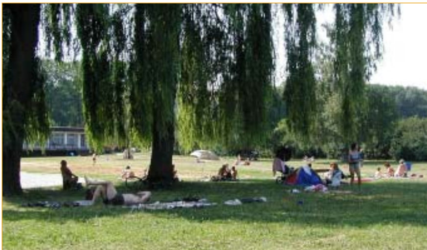
Báječný čas prázdnin a dovolených je tady. Přejeme všem čtenářům NN ať si je užijí podle svých představ a šťastně a odpočívání se vrátí zpět ke svým povinnostem.