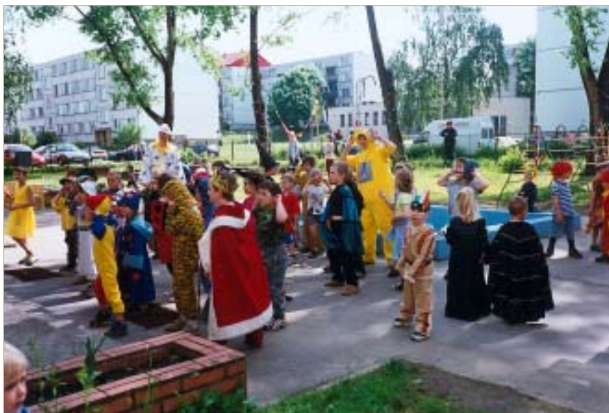
Jak jinak než pohádkově slavily děti čtvrtstoletí své školky.