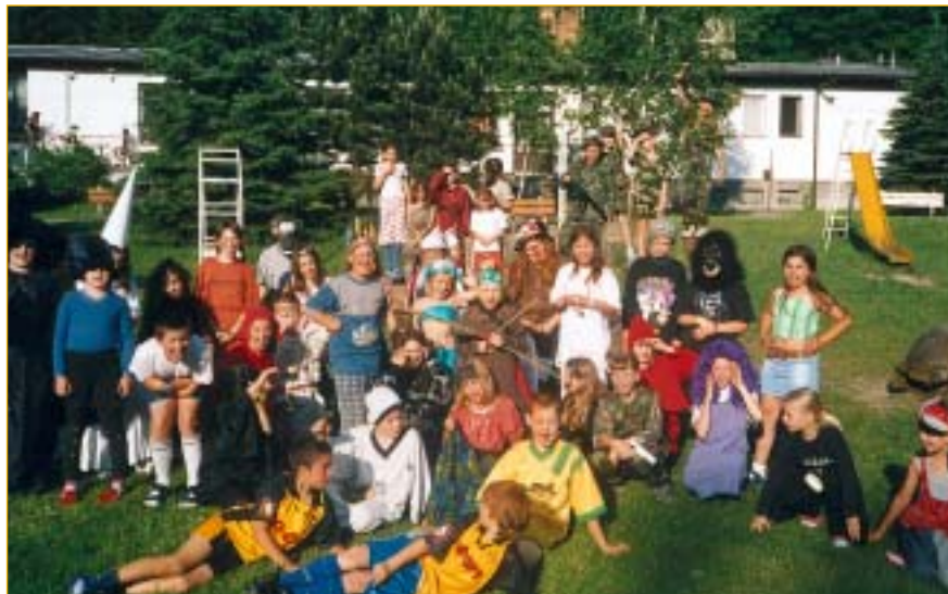
Jeden z týdnů tráví žáci 3. a 4. tříd I. základní školy v nádherné přírodě kolem Rožnova.

Hlavním úkolem školy je vzdělávat a ve spolupráci s rodinou i vychovávat. Dobrý a moudrý učitelství sbor je nutný. Přestože je na naší škole téměř stoprocentní aprobovanost a všichni učitelé (až na dvě) mají vyso-