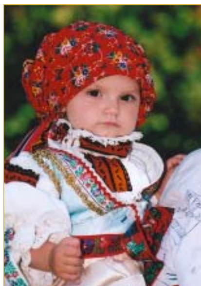
Půlstoletí úspěšné činnosti za sebou a nadějnou budoucnost před sebou - takové byly padesátiny slováckého souboru Radovan.