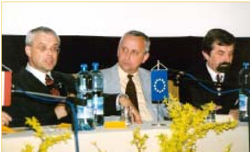
"Evropské jaro v Napajedlích" - nejvýznamnější událostí několika akcí zahrnutých pod tímto názvem byla návštěva premiéra České republiky Vladimíra Špidly v našem městě. Její úvodní část tvořila beseda předsedy vlády s občany v městském kině.

5 000 Kč dar ZŠ Komenského 298 4 800 Kč koncert Moravských učitelů 7 740 Kč ples společnosti TSM, NBTH a NTVcable 3 418 Kč dary občanů 20 958 Kč celkem