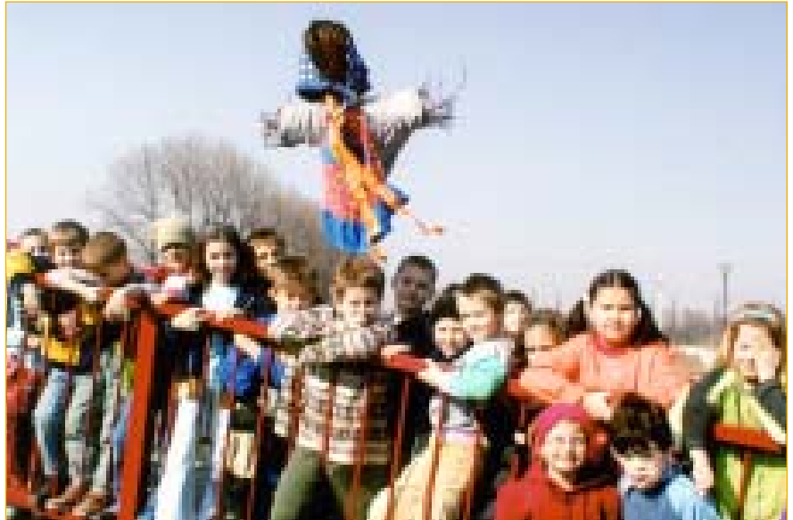
25. března děti ze školní družiny I. ZŠ natrvalo pro letošní rok uspaly paní zimu a přivítaly jaro.