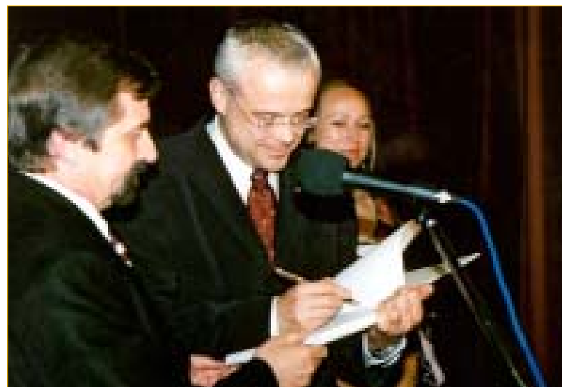
Návštěva premiéra je v historii Napajedel mimořádná událost a připomínat ji bude zápis v pamětní knize města.