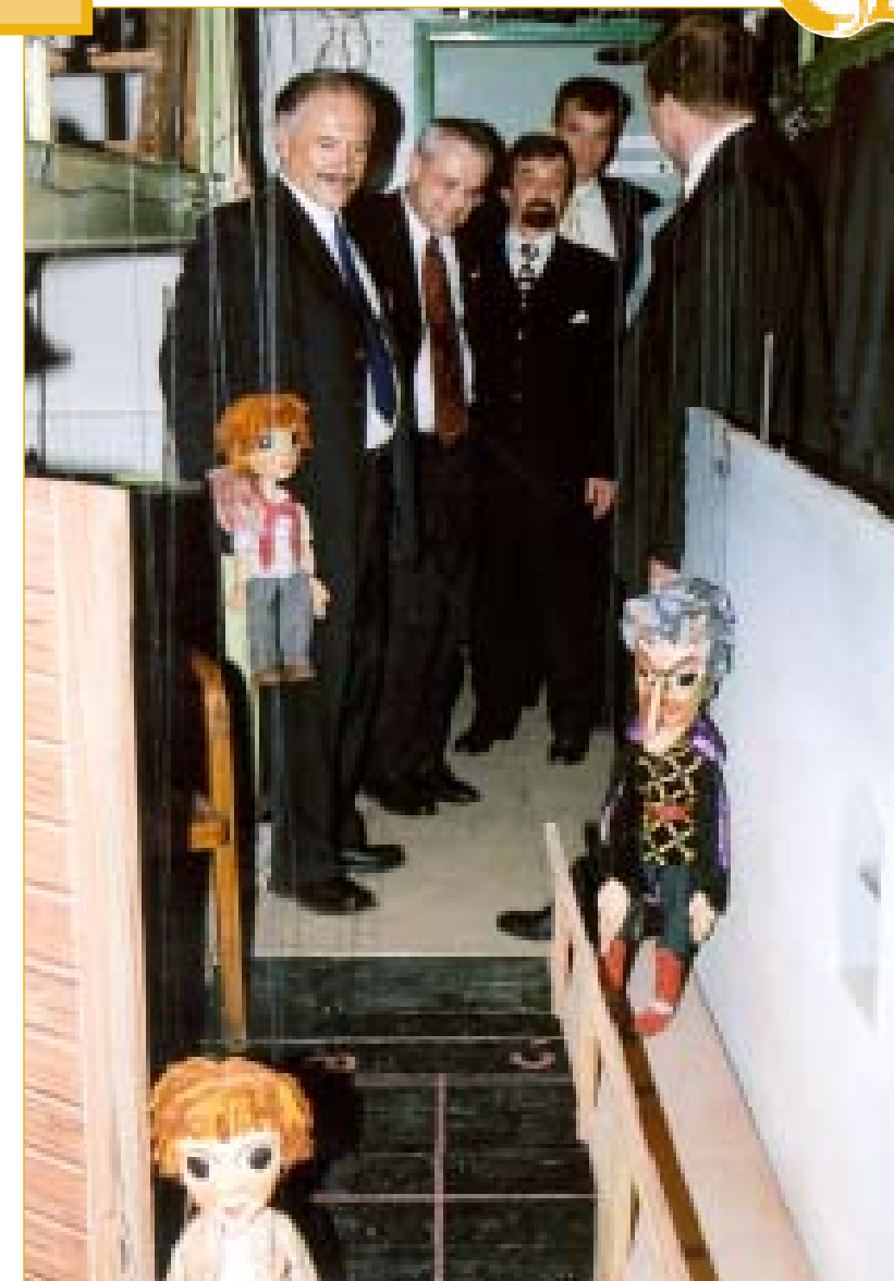
... a předvedla i své loutkové divadlo, kterých je v republice poskrovnu. Premiéra návštěva v divadle zjevně potěšila a přiznal se ke své lásce k loutkovému divadlu.