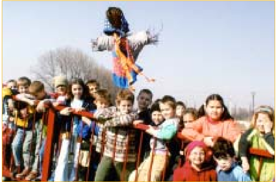
25. března děti ze školní družiny I. ZŠ natrvalo pro letošní rok uspaly paní zimu a přivítaly jaro.