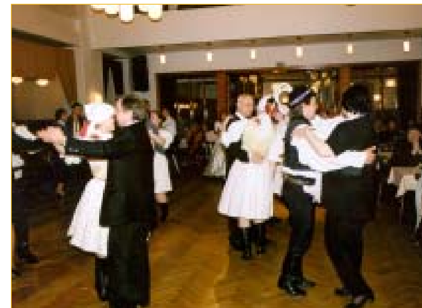
Premiér přijal vyzvání k tanci v lidovém tónu a s chutí si zatancoval i při moderní muzice.