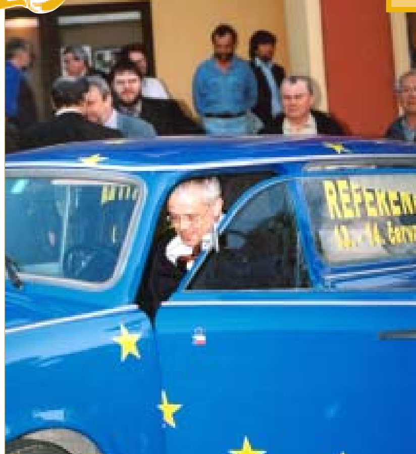
Důvodem návštěvy premiéra Špidly bylo odstartování přípravy na referendum o vstupu ČR do Evropské unie. Stalo se tak bezprostředně po vyhlášení termínu konání referenda prezidentem republiky a premiér ochotně zapózoval novinářům v přistaveném trabantu se symbolikou EU.