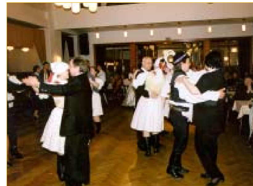
Premiér přijal vyzvání k tanci v lidovém tónu a s chutí si zatancoval i při moderní muzice.