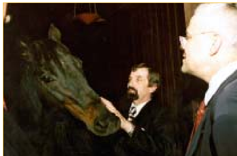
Napajedla se pochlubila chovatelskými úspěchy Hřebčína ...