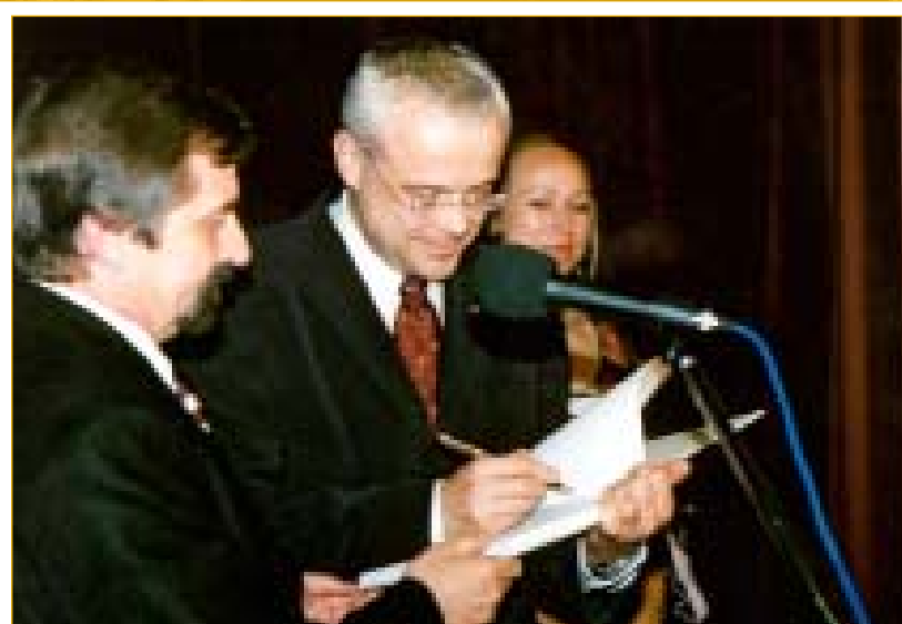
Návštěva premiéra je v historii Napajedel mimořádná událost a připomínat ji bude zápis v pamětní knize města.