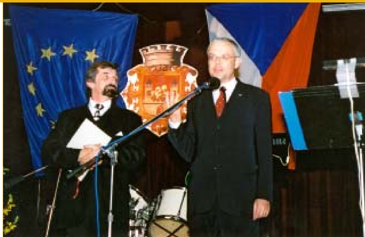
V zahajovacím projevu na Plese krále Jiřího z Poděbrad zdůraznil historickou souvislost této významné postavy českých dějin se současným děním. Snahy českého krále jsou první historicky doloženou snahou o mírové sjednocení evropských zemí.