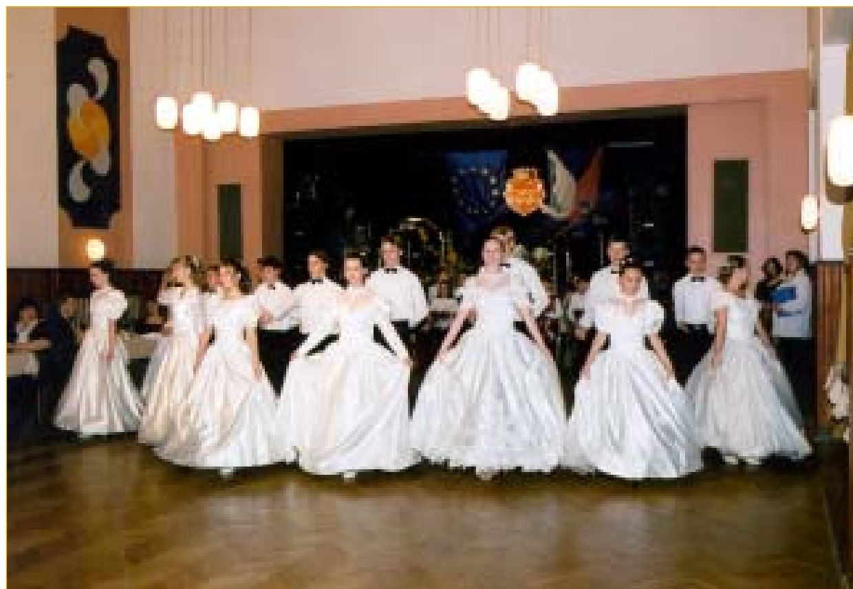
Slavnostní předtančení předvedl soubor BŘEZOLUPSKÝ BOTÍK, dále vystoupili smyčcový soubor žáků ZUŠ R. Firkušného, divadelní soubor Z. Štěpánka a taneční soubor Radovan.