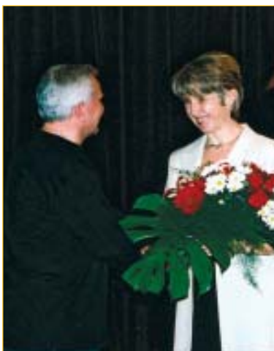
Fatra je tradičním sponzorem festivalu a pozorným patronem jednoho soutěžního večera. Tradic se pomalu stává i pravidelné partnerství s přerovským Divadlem Dostavník.