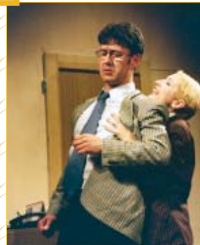
Lehoučký, skvěle vypointovaný příběh plný vtipných gagů, ve kterém postavy sklizejí jednu osudovou ránu za druhou a divák se skvěle baví. A smích je to neskonale dobrý, ještě mockrát, profesore.