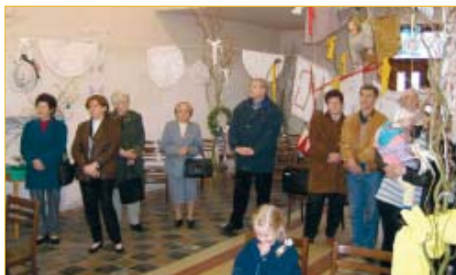
Velikonoční týden Muzejního klubu v bývalé klášterní kapli. Výstava lidových výšivek je dílem Josefa Součka.