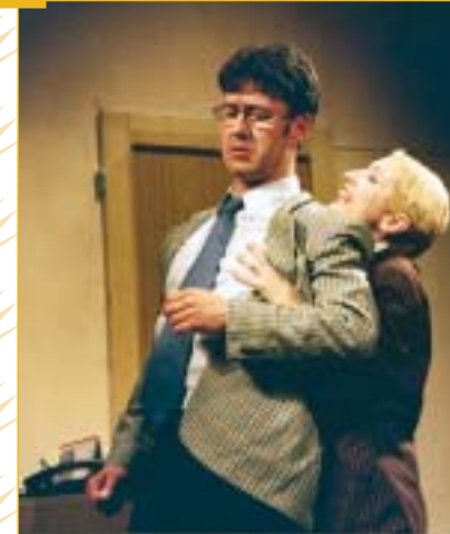
Lehoučký, skvěle vypointovaný příběh plný vtipných gagů, ve kterém postavy sklizejí jednu osudovou ránu za druhou a divák se skvěle baví. A smích je to neskonale dobrý, ještě mockrát, profesore.