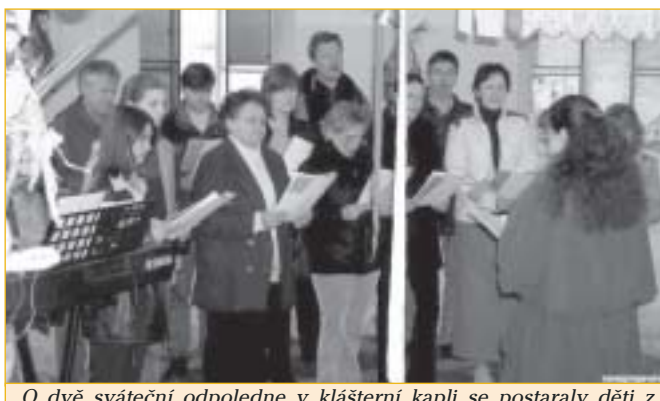
O dvě sváteční odpoledne v klášterní kapli se postaraly děti z Radováňku a základní umělecké školy. Třetí velikonoční odpoledne patřilo církevnímu pěveckému sboru Mirky Medkové.