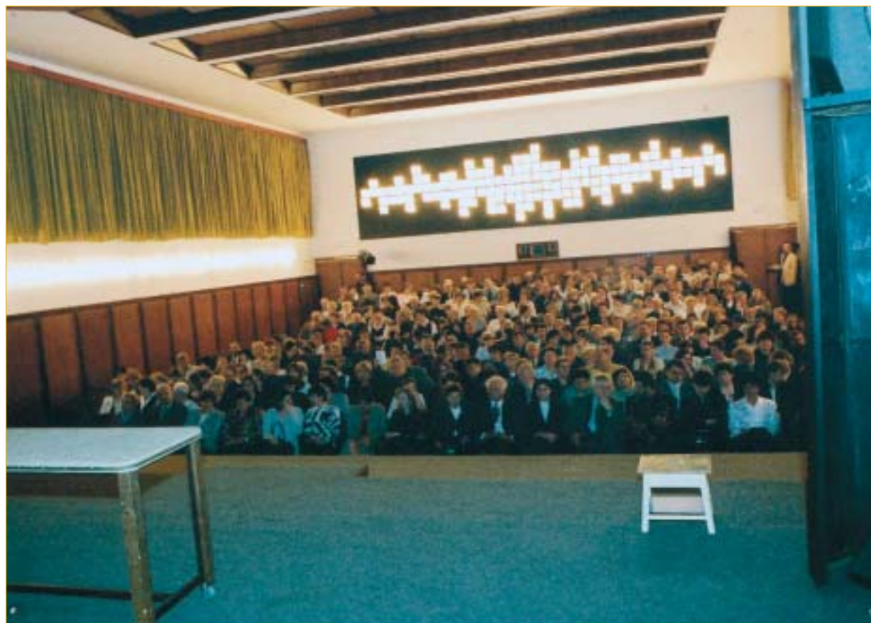
Po sedm festivalových dnů vitalo soutěžní soubory hlediště plné vnímavých a uznalých diváků. I jejich podíl na úspěchu festivalu byl perfektní.