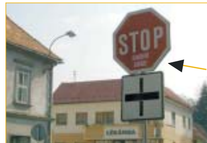
Vadí - nevádí? Odlákání pozornosti řidiče může stát lidský život. Nevím jak vy, ale mně takoví ochránci zvířat vadí. -bv-

Na ukončení valné hromady jsme si všichni společně zazpívali sokolskou píseň „Spějme dál“. M. Vykoukal, TJ Sokol Napajedla