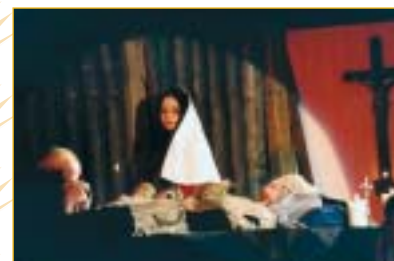
Jméno autora inscenace nenechalo nikoho na pochybách, že spíše než o střety postav, půjde o střety idejí. A spíše než jako drama působilo Zvěstování Panně Marii jako liturgický obřad.