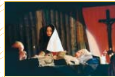
Jméno autora inscenace nenechalo nikoho na pochybách, že spíše než o střety postav, půjde o střety idejí. A spíše než jako drama působilo Zvěstování Panně Marii jako liturgický obřad.