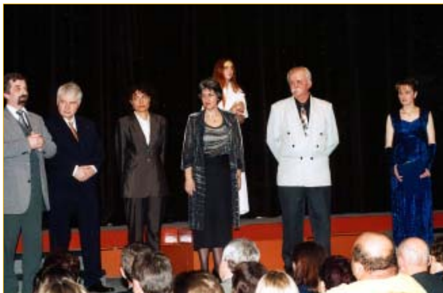
Uplynulý týden patřil 46. divadelnímu festivalu ochotnických souborů. ze zahajovacího večera v Klubu kultury Napajedla.