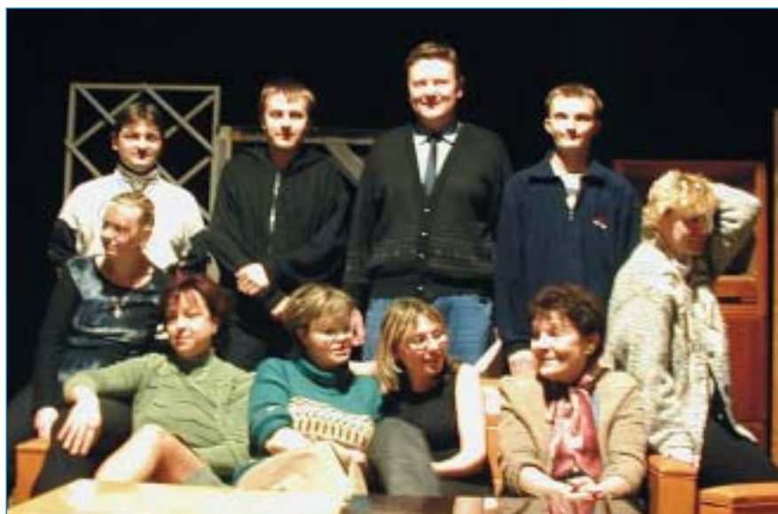
Divadlo Zdeňka Štěpánka