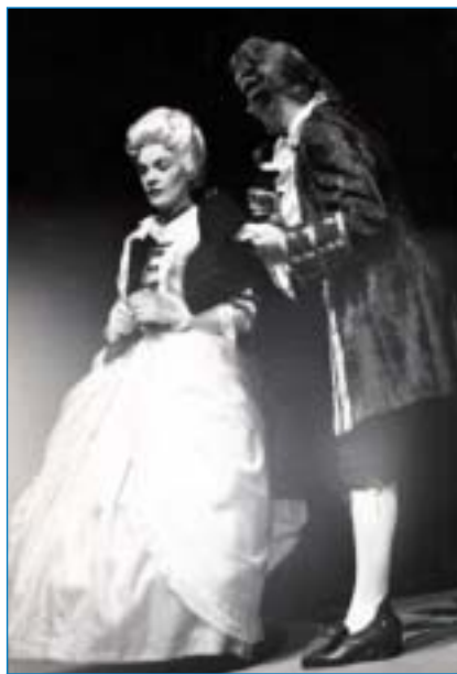
Lucerna - 1965

Neřekla bych, že mi něco vzal! Konečně, vždycky jsem mohla odejít. Možná snad jediné čas, bezpočet hodin, dní... ale - využila