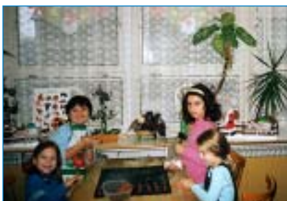
Dnes si svými dílky zdobíme okna školní družiny a jednou, až budeme velké...

Dělení do oborů vnímají tak vyhraněně spíše jen dospělí, děti mají jiné dělení. Září – hraje se ve škole, říjen – podzim, listopad