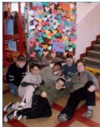
Soudě podle 14. února, celá stará škola je zamilovaná.

Poslední skupina – to byly vzkazy pro paní učitelky: Máme rádi paní učitelku Poláškovou. Milujeme matiku. Naše paní učitelka Svobodová je super.