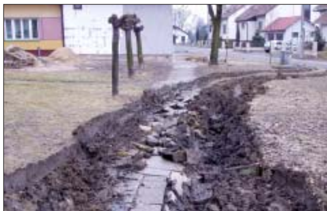
Domíchávač s poctivou dávkou betonu a předjarní vlahé počasí - a je to!!

V kapitole 3612 se počítá s výměnou oken ve zdravotnickém středisku v hodnotě 800 tis. Kč a s vybudováním bezbariérového WC v hodnotě 200 tis. Kč, rekonstruována bude kotelná A na tržiště částkou 300 tis. Kč a 600 tis. Kč představují výměny balkonů v bytových domech 1350 a 1351. V kapitole 3632 je zahrnuto plánované vybudování urnových míst na místním hřbitově v částce 150 tis. Kč. Kapitola 3222 počítá s opravou schodiště ke kostelu, částkou 200 tis. Kč je tato oprava dotována státem. Z kapitoly 3639 budou financována náklady na zpracování projektů a studií budoucích investičních akcí.