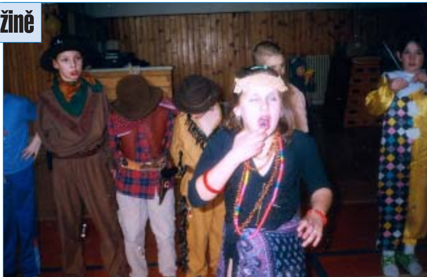
Při karnevalu to bývá super v každém ročním období.

– žijeme mezi Indiány, prosinec – čas Vánoc, leden – stavíme sněhuláky, únor – výpravy za sněhem, březen – jaro je tu a sním i karneval, duben – velikonoční nálada, květen – z pohádky do pohádky a červen – děti z celého světa si hrají společně.