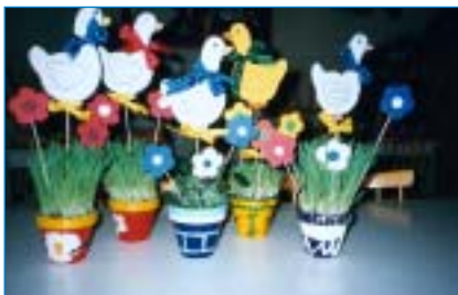
Zrovna teď se nejvíc těšíme na jaro, předtím se nám moc líbila zima, ale až bude léto....

Činnost rekreační, to jsou především pohybové aktivity – pohybové hry, relaxační cvičení, jóga. Na hřišti i v místnostech družiny, při vycházkách do přírody.