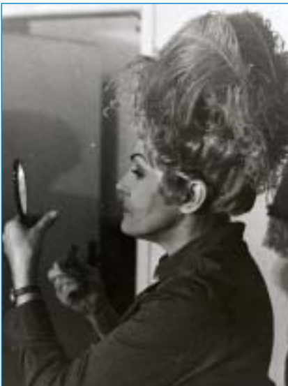
Noc s Casanovou - 1984

Byly to docela jiné časy, příležitosti k zábavě bylo mnohem méně a všichni jsme po válce chtěli užívat života. Za každé představení byli diváci nesmírně vděční. Dnes jsou náročnější, mají spousty jiných příležitostí k zábavě a ať chtějí nebo ne, srovnávají. Snažíme se seč nám síly stačí nepoměrně vyšším nárokům vyhovět a víme, že nám hodně chybí k dokonalosti. Nesmírně nás však těší bavit lidi, přinášet jim trošku radosti v této uspěchané době. Máme je rádi a vážíme si toho, když naši snahu ocení svým zájmem a potleskem.