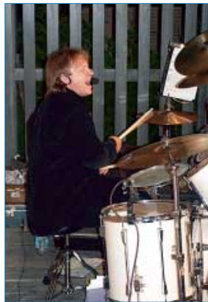
K létu v Napajedlích již několik let patří páteční posezení před klubem s živou hudbou a tancem.