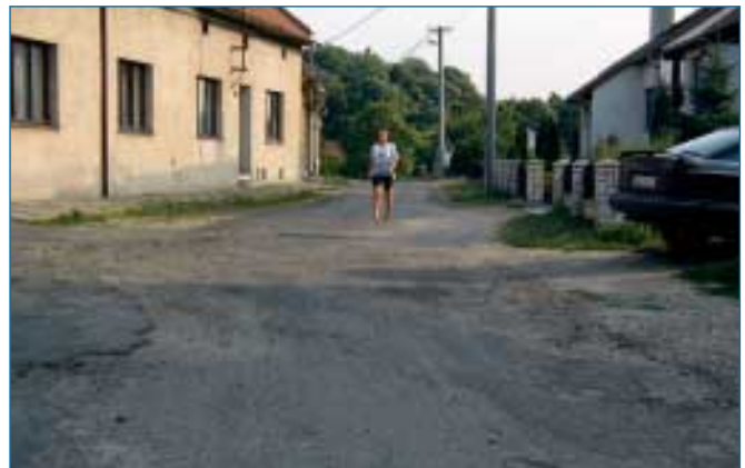
Ulice Pod Kalvárií před opravou.