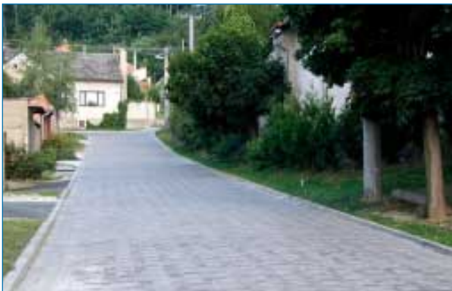
Ulice Hřbitovní po opravě.