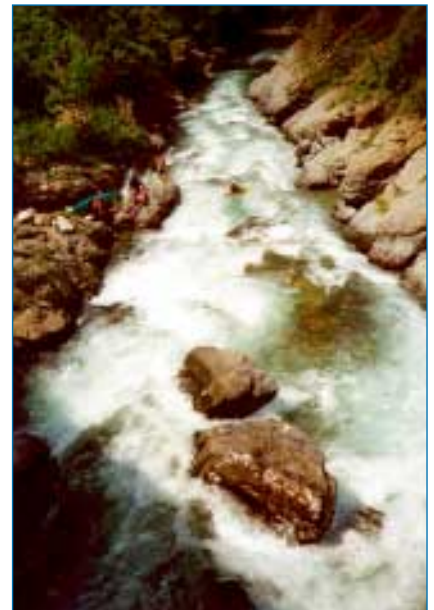
Francie - řeka Roya

A teď zpátky na cestu. Ještě v neděli večer jsme se přesunuli na krásnou, ale dost těžkou řeku Guil (WW III - V). Spali jsme pod