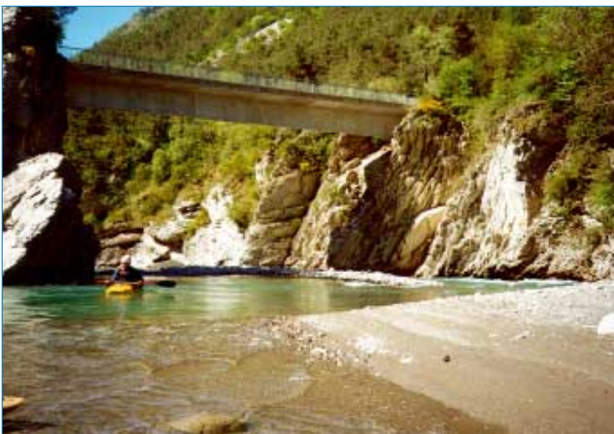
Francie - řeka Verdon