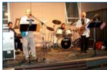
Letošní sérii nezahajoval nikdo menší než Aventus.