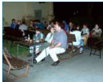
Při hezkém počasí zažijeme ještě další příjemné večery i v srpnu.