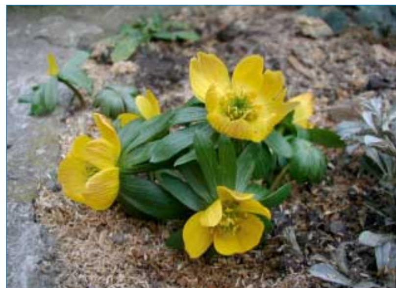
Dříve než jsme my ostatní odložili kabáty a teplé boty, otevřela se jarnímu sluníčku a vyhledovělým včelkám. Křehká a zranitelná, sladká a pohostinná. Jarní kráska.

A tak si říkám, že je to dobře, že je na světě dost "obyčejného" genetického materiálu. Co kdyby někdo občas potřeboval nějakou vrazil.