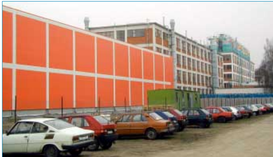
Díky mimořádně příznivému počasí vyrostla přes zimu ve Fatře nová hala, která svou barevností zapadá do baťovské architektury ale její technologické vybavení patří k současné evropské špičce.

dvou nebo třech vrstvách. Součástí výrobních linek je granulovací zařízení, které vrací zpět do výroby veškerý technologický odpad.