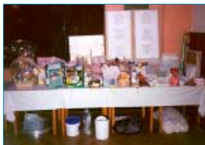
Vystavené ceny lákaly k nákupu losů do tomboly, ale zároveň se mohli hosté dovědět, kteří podnikatelé, firmy či jednotlivci jsou hasičům příznivě nakloněni.

Pořadatelé se ukázali v dobrém světle i pestrou nabídkou bufetu, který si rozhodně nemohl stěžovat na nezájem hostů. Není divu, že po loňském ne příliš skvělém začátku získali hasiči více chuti k pořádání svého výročního bálu opět v příštím roce.