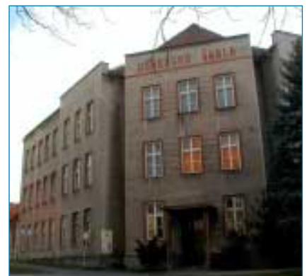
Darovací listinou a odkupem přilehlých pozemků přešla do vlastnictví města bývalá škola na klášteře. O tom, jak bude budova využita, zatím městské zastupitelstvo nejednalo.