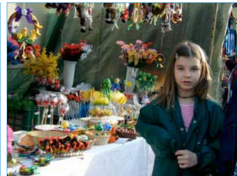
Co budou letos kluci brát? Vajíčka, žvýkačky, čokoládu, perníčky, stužky....? A přijdou s tatarem, proutkem nebo s jalovcem?

Večer Vám příjemná na klávesy M. Nováková a cimbálová muzika Linda, bohatá tombola, skvělá odrůdová vína a další občerstvení. Vstupné s místenkou 60 Kč, předprodej Sadová 780.