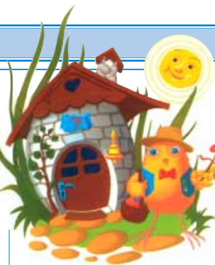
(Kreslené motivy na této i první straně jsou ze sáčků vyrobených ve Fatře k Velikonocím 2002.)

Poslední postní den byla Bílá sobota , kdy bylo Ježíšovo tělo sejmuto z