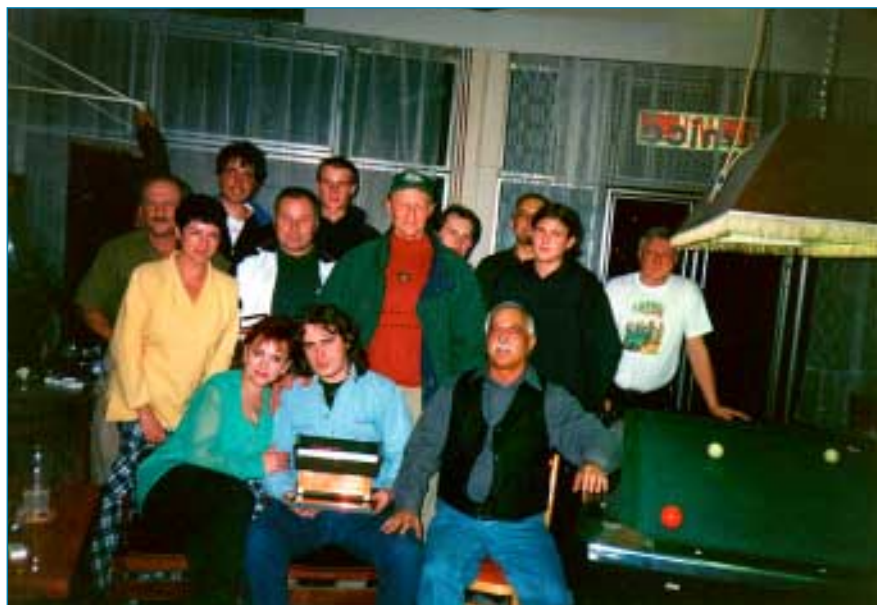
Hráči soupeří pouze při hře, jinak je to docela dobrá parta