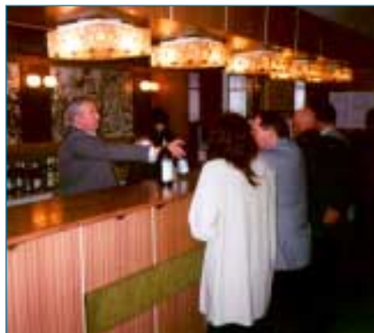
Červené víno je většinou žádanější než bílé. U "hasičů" se vypilo červeného asi dvakrát více než bílého.