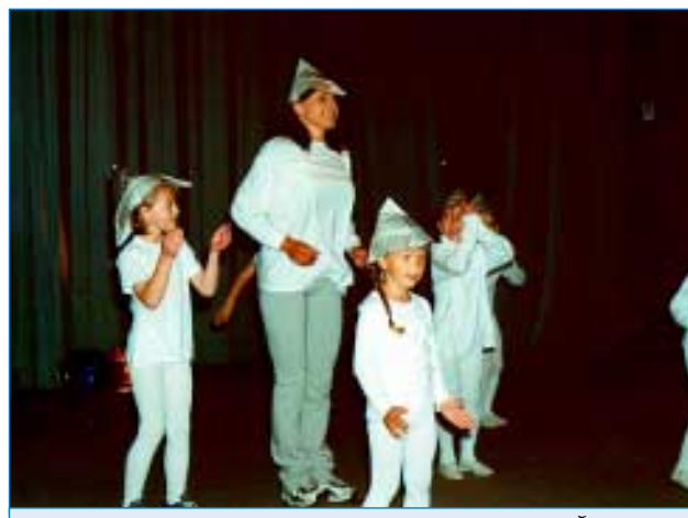
23. června - Odpoledne plná pohádek - Divadlo Zd. Štěpánka a aerobik J. Muchové