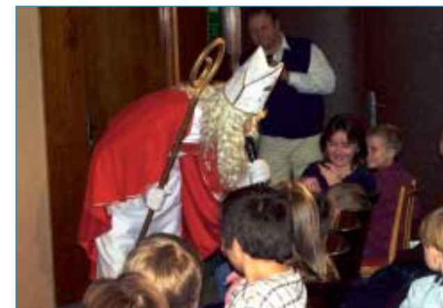
2. prosince - Psaníčko pro sv. Mikuláše