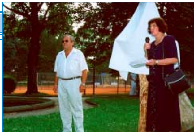
18. srpna - Moravské chodníčky - starostka města a hlavní sponzor akce.

V loňském roce uspořádal Klub kultury ve spolupráci s dalšími institucemi a spolky pro občany města přes čtyřicet kulturních akcí. Z pohledu celkové návštěvnosti pořadů i z pohledu finančního vyhodnocení můžeme mluvit o spokojenosti, i když důležitější je spokojenost návštěvníků. K programům s tradicí. Jako je divadelní festival, výstava hub a vánoční koncerty přibýly další - Svatý Václav a Moravské chodníčky. Ty budou tvořit konečně i hlavní osu pořadů pro rok letošní.