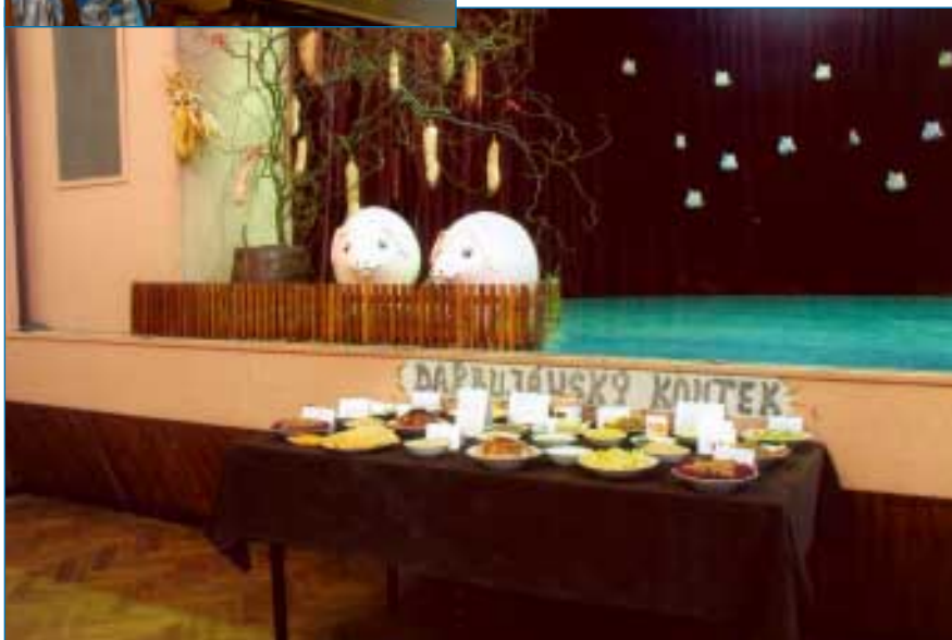
Dalo to sice hodně práce, ale v sokolovně nechyběly jitrničky ani na stromě ani na stole. Především však nechyběla dobrá nálada a chuť se společně bavit.