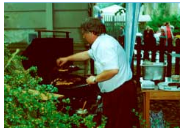
Hry i chléb - taková je kompletní nabídka klubu.