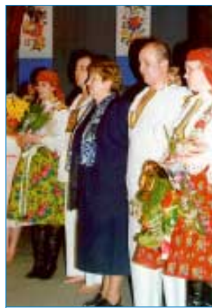
8. května - Život s písničkou a tancem - jubilejní koncert