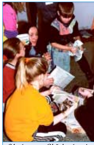
24. února - Obžalována je lhostejnost - výtvarná soutěž s ekologickou tematikou.