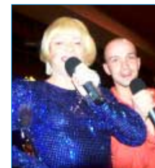
27. prosince - Travestí show