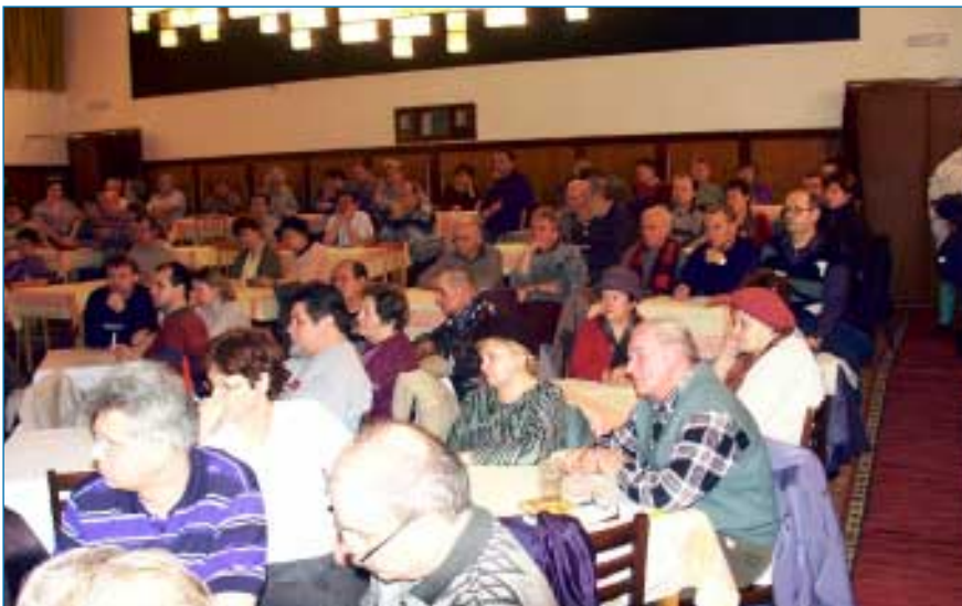
Výklad práv a povinností majitelů bytů jakož i všechna další ustanovení novely zákona č. 451/2001 Sb. přilákaly do velkého sálu Klubu kultury v zámeckém parku okolo dvou set majitelů bytů.