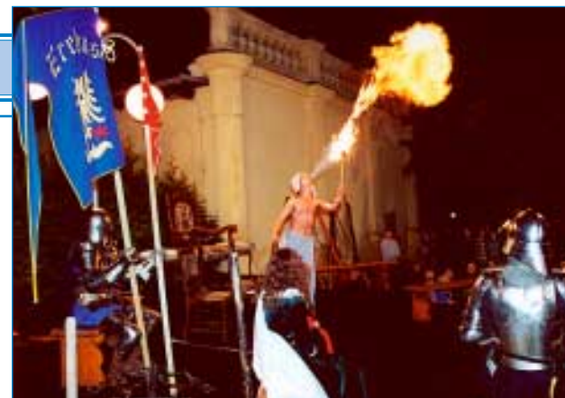
27. září - Svatováclavský večer - Napajedla sobě