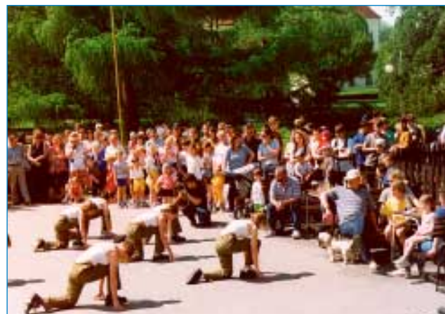
1. května - Den Země