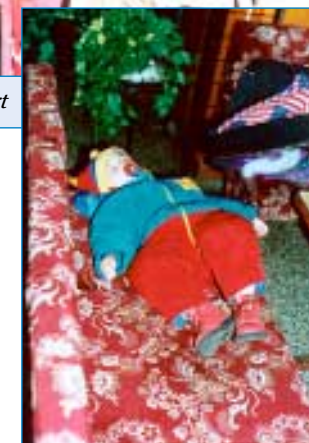
Nezlobte se - ale bylo toho na mne dost.