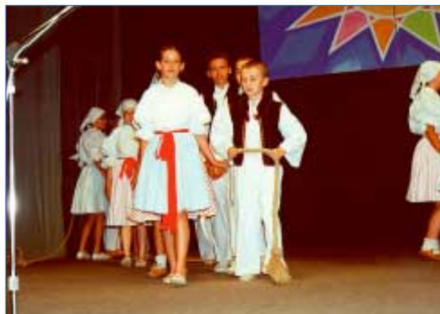
27. června - Radovánek pro Napajedla