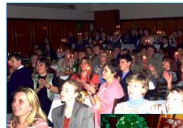
17. prosince - Vánoční koncert