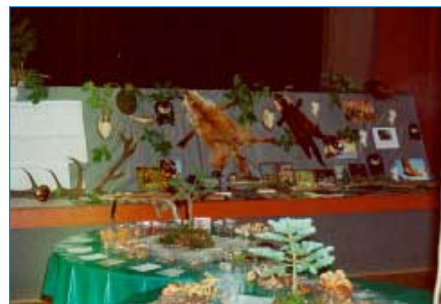
30. září a 4. října - Výstava hub, brouků a motýlů, bonsajů a loveckých trofejí