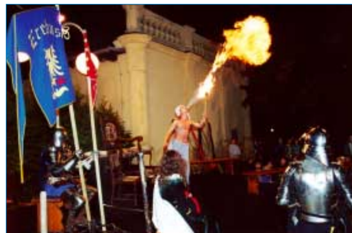
Atraktivní podívanou mezi historickými souboji byl fákír se svým ohnivým vystoupením.

Jisté je, že bez Václava by český stát možná nikdy nevznikl, alespoň