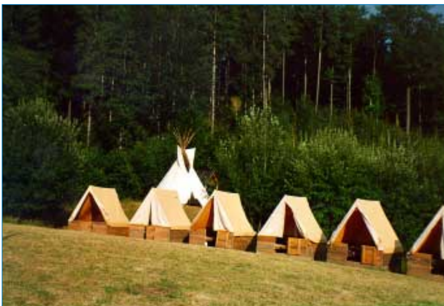
Že bylo po celou dobu všude vzorně uklizeno a po našem odjezdu zůstal v údolí dokonalý pořádek ke skautským záborům také patří.