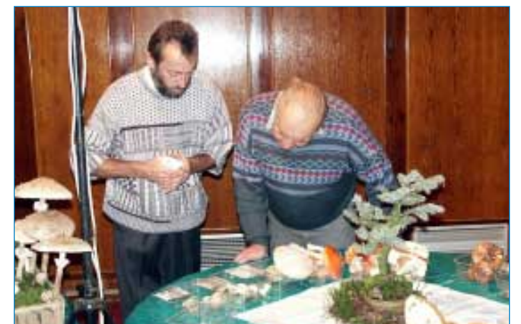
Někdy je třeba si houbu řádně prohlédnout - nejlépe tenkrát, když ještě nejde o život. O členech mykologického kroužku to samozřejmě neplatí.