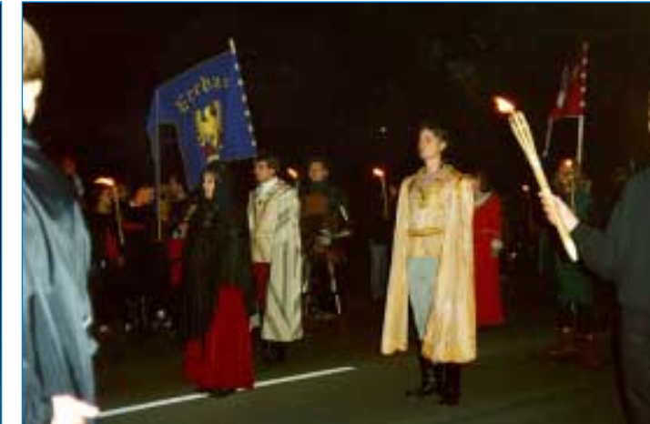
Večerní svatováclavský průvod byl jakousi alegorií Václavova života, nebo spíše toho, co o něm víme.

vedlivým, ale také prozíravým vládcem. Z nepatrného území systematicky budoval přemyslovský stát. I mocní Slavníkovci uznali jeho vládu. Určitě ne dobrovolně.