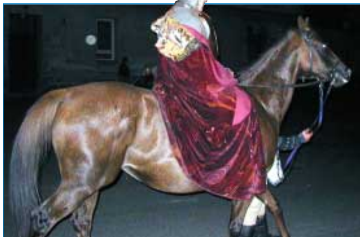
V průvodu nesměl chybět svatý Václav na koni, tak jak ho národ vidí ve svých legendách.