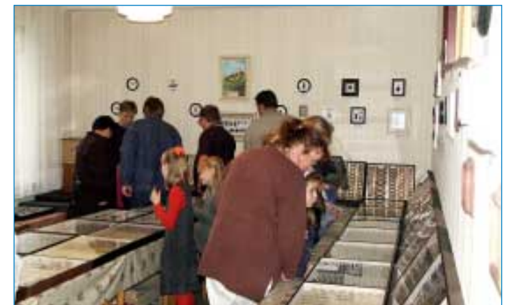
Kromě bonsajů a mysliveckých trofejí v poslední době patří již řadu let k houbařské výstavě sbírky brouků a motýlů. Rok od roku početnější a zajímavější.