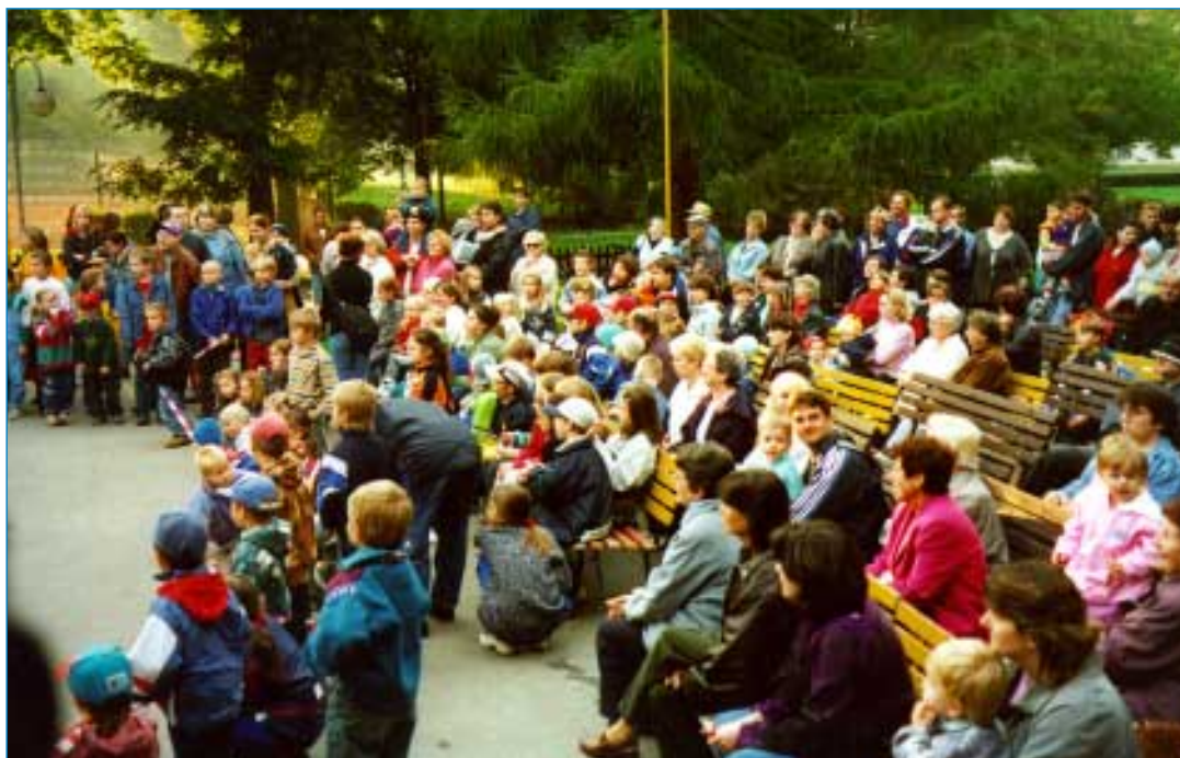
Děti i dospělí jim skvěle rozuměli a svou aktivní účastí celý program dotvářeli.