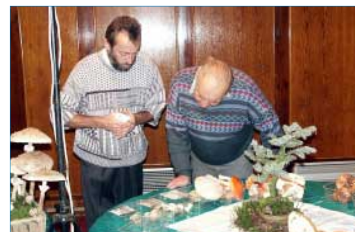
Někdy je třeba si houbu řádně prohlédnout - nejlépe tenkrát, když ještě nejde o život. O členech mykologického kroužku to samozřejmě neplatí.