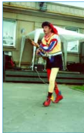
Máš-li radost a víš o tom, zatleskej...zadupej... zamávej.... A děti tleskaly, dupaly, mávaly