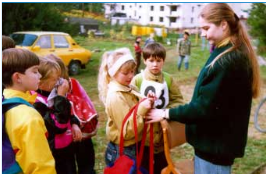
Závody bereme vážně - v přípravě, na trati i při povzbuzování kamarádů.