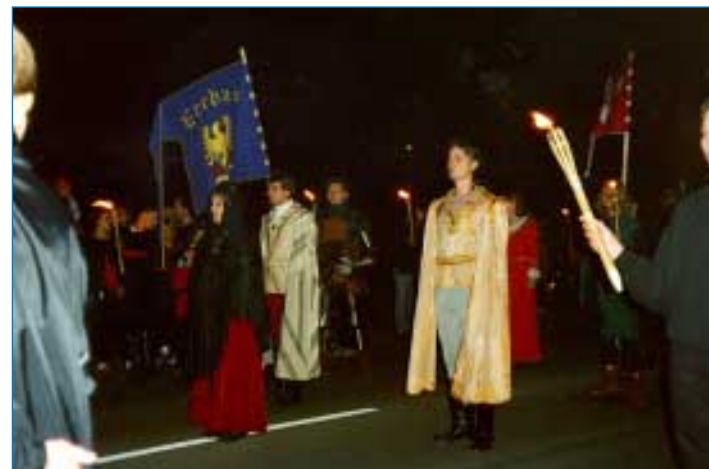
Večerní svatováclavský průvod byl jakousi alegorií Václavova života, nebo spíše toho, co o něm víme.

vedlivým, ale také prozíravým vládcem. Z nepatrného území systematicky budoval přemyslovský stát. I mocní Slavníkovci uznali jeho vládu. Určitě ne dobrovolně.