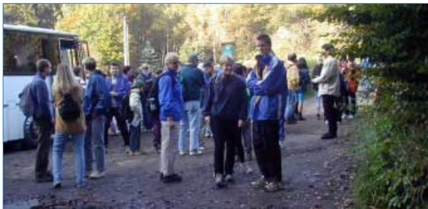
Skutečný start letošního ročníku pochodu podzimmními Chříby byl pro 223 pěších účastníků na Bunči.