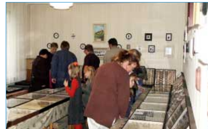
Kromě bonsajů a mysliveckých trofejí v poslední době patří již řadu let k houbařské výstavě sbírky brouků a motýlů. Rok od roku početnější a zajímavější.