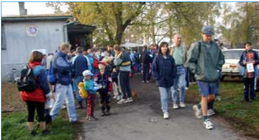
KČT v Napajedlích pořádá již třicet let podzimní výlety po pěšinách a cestách v Chříbech. V sobotu 13. října se dostavilo na start celkem 245 turistů pěšky i na kolech.