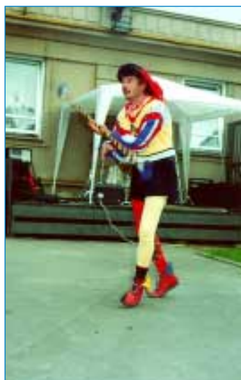
Máš-li radost a víš o tom, zatleskej...zadupej... zamávej.... A děti tleskaly, dupaly, mávaly