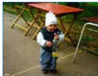
Matýsek měl radost pořad. Než upadl a natloukl si. Slzičky však neměly dlouhého trvání