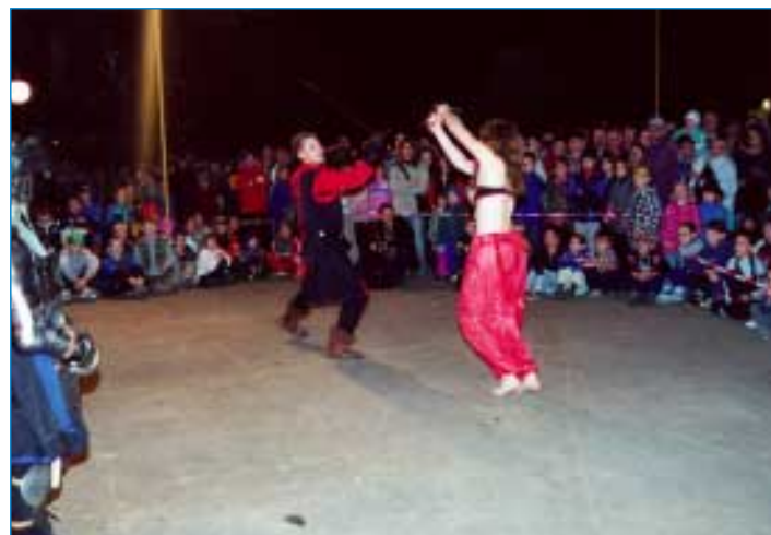
Inu - rovnoprávnost vládne skutečně všude.

Křesťanství u nás nebylo v desátém století všeobecně rozšířené, týkalo se pouze úzkého okruhu lidí kolem knížecího dvora. Jako nástroj moci mohlo posloužit ihned, vyvrátit pohanství z kořenů však byla práce na věky. Václav byl nejspíš horlivým věřícím, určitě dobrým a sprá-