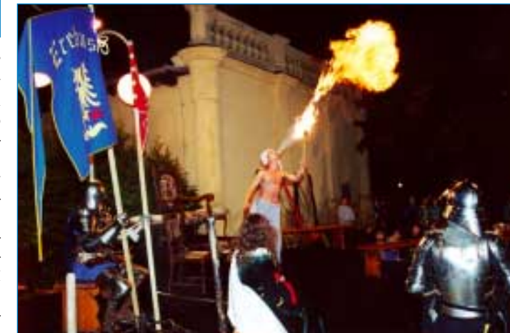
Atraktivní podívanou mezi historickými souboji byl fákír se svým ohnivým vystoupením.

Jistě je, že bez Václava by český stát možná nikdy nevznikl, alespoň