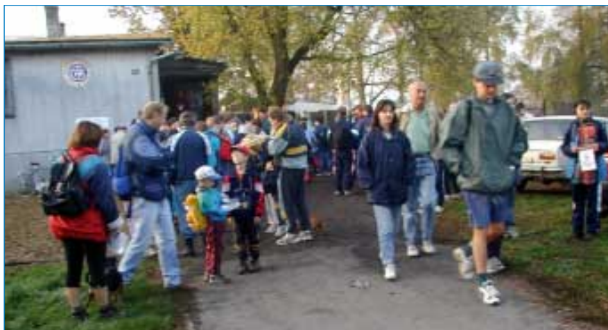
KČT v Napajedlích pořádá již třicet let podzimní výlety po pěšinách a cestách v Chříbech. V sobotu 13. října se dostavilo na start celkem 245 turistů pěšky i na kolech.