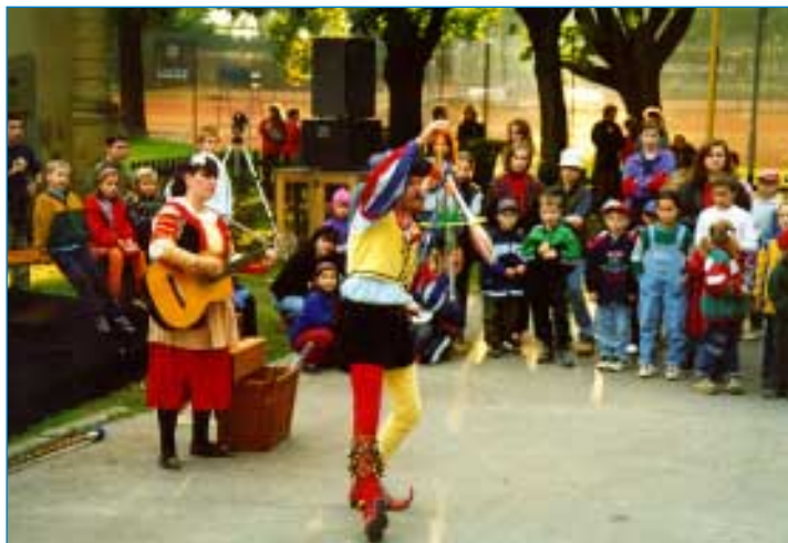
Vystoupení kejklířů oplývalo veselými písničkami a žertovnými triky.

Účastníci a diváci historického průvodu městem v předvečer Václavova svátku o posledním zářijovém víkendu si tím zcela určitě hlavu nelámali. Přišli prostě na pěknou podívanou a díky režii Klubu kultury bylo na co se dívat. Čekání před městskou radnicí příjemně koncert dechové hudby Topolanka. Když rachot bubny a světla pochodní zaplnily náměstí, dýchlo z nich něco tajuplného. Průvod přinejmenším stovky lidí v historických kostýmech se na nepostřehnutelný pokyn zastavil, aby z osvětleného balkónu radnice vzdala hold - nikoliv knížeti, nikoliv svatému Václavovi - ale patronu české země starostka města. Když se dalo velkolepé divadlo znovu do pohybu, přidávali se k průvodu další a další lidé a v počtu snad čtrnácti set zaplavili prostranství před klubem. Improvizované hlediště, které v pozdním odpolední hostilo několik stovek dětí při rozmarném vystoupení středověkých kejklířů, je pojalo jen stěží. Vystoupení obou skupin historického šermu navodilo patřičnou atmosféru, která vyvrcholila předáním symbolického klíče starostkou města největšímu z největších národních hrdinů. Ještě nějakou dobu poté bylo před klubem veselo za doprovodu živé hudby. Těšili se z přítomnosti a pranic nehloubali nad tajuplnou minulostí osobnosti, jejíž význam pro český stát byl oceněn státním svátkem.