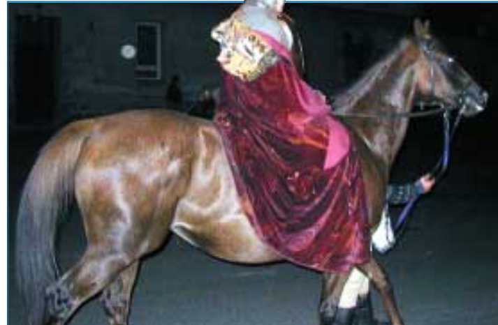
V průvodu nesměl chybět svatý Václav na koni, tak jak ho národ vidí ve svých legendách.