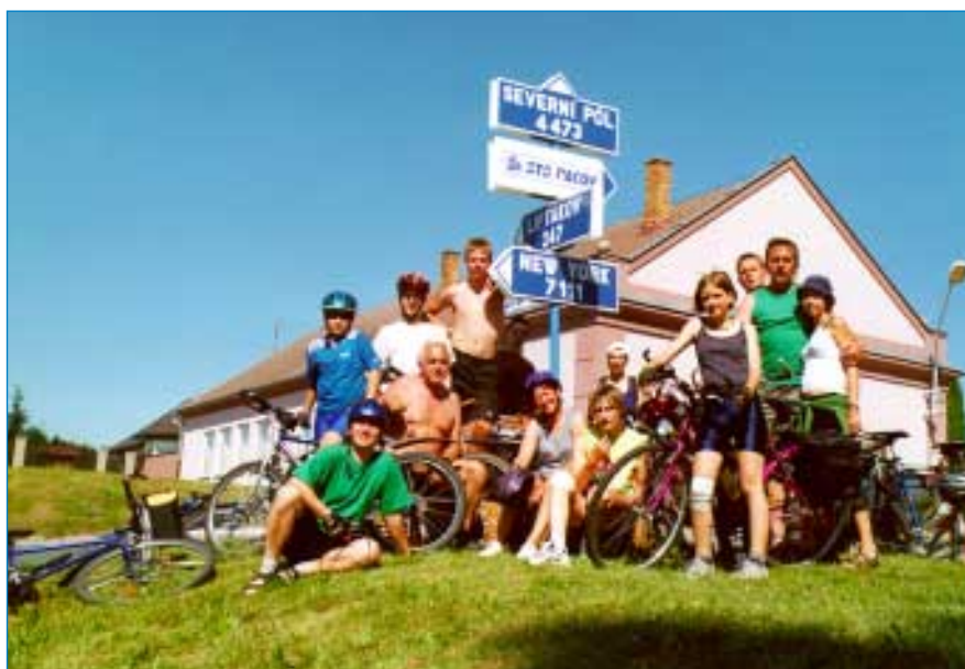
Deset dnů jsme neviděli televizi, ale byly okamžiky, kdy jsme věděli přesně, kolik kilometrů nás dělí od Severního pólu, New Yorku i Liptákova.