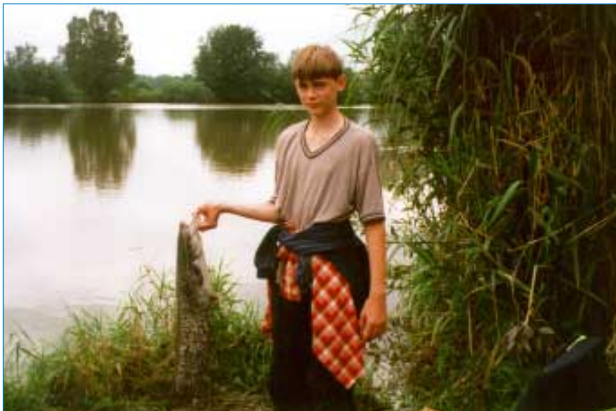
Báječné prázdniny u vody k lítosti všech mladých rybářů skončily, z rekordních úlovků zbyly jen vzpomínky a fotografie.