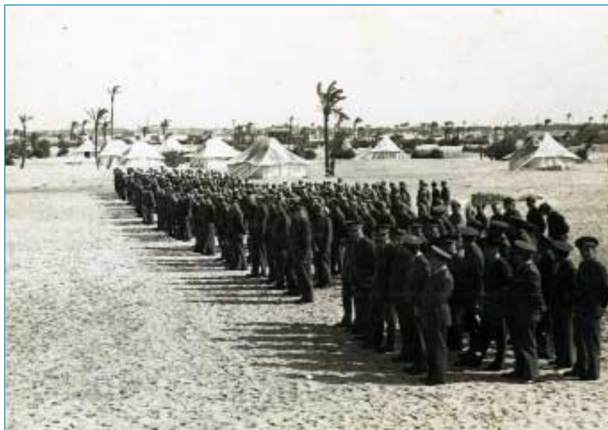
Agami - Egypt, 31. 5. 1941. Nástup čs. 11. pěšího praporu - Východního, v den odchodu na frontu na egyptsko-libyjskou hranici

Než k tomu došlo, dostali jsme nový úkol - ochranu letišť v blízkosti fronty, v jejímž týlu byli vysazeni nepřátelští výsadkáři. Skutečnost, že nám britské velení tento úkol svěřilo, svědčilo o jeho důvěře k nám. K přímému boji s nepřítelem zde sice nedo-