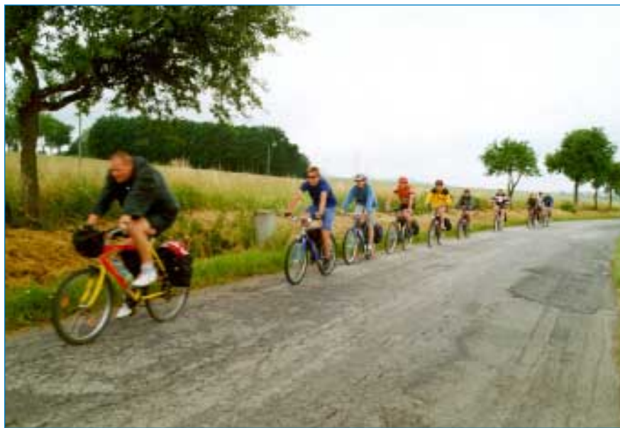
Do kopečka se to táhne, ale dolů, to je paráda...

Nezapomenu na důkladnou prohlídku Konopiště s výkladem historie od pěstování konopí až po slavný výrok "tak nám zabyli Ferdinanda" - zámeckého pána - čímž začala