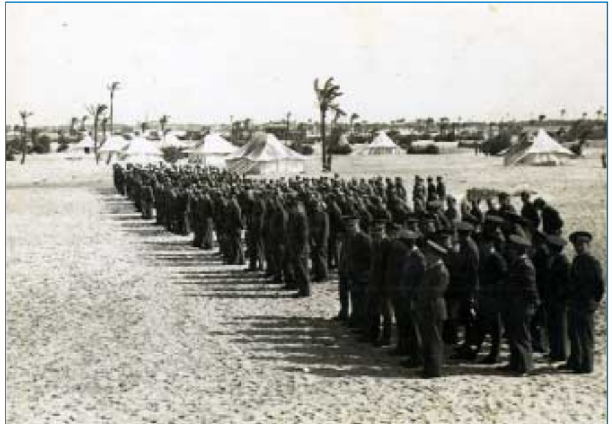
Agami - Egypt, 31. 5. 1941. Nástup čs. 11. pěšího praporu - Východního, v den odchodu na frontu na egyptsko-libyjskou hranici

Než k tomu došlo, dostali jsme nový úkol - ochranu letišť v blízkosti fronty, v jejímž týlu byli vysazeni nepřátelští výsadkáři. Skutečnost, že nám britské velení tento úkol svěřilo, svědčilo o jeho důvěře k nám. K přímému boji s nepřítelem zde sice nedo-