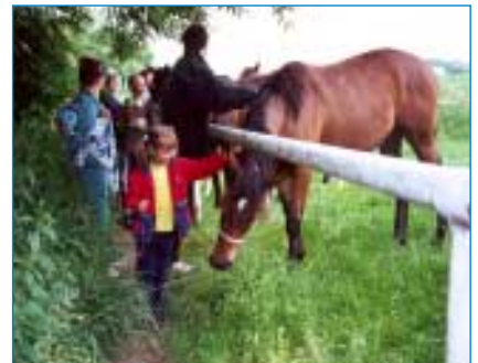
Zastavení u koní bylo zcela neprogramové, ale málokdo mu odolal.