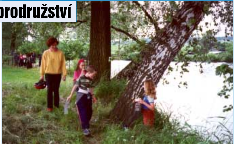
A pokud neděsily filmové příšerky samy o sobě, klidně si na vás houkaly zpoza stromů. Takhle utekla z Obecné školy

Celou trasu prošly děti maskovány válečným malováním Vinnetoua a plnily spoustu úkolů. Ze starého vraku se stalo jejich přičiněním krásné barevné plavidlo kapitána Nema, odpad byl roztříděn do patřičných kontejnerů a i ten, kdo česnek nerad, z obavy před Draculou si dal topinku. Naopak u čarodějnice Saxany čekaly na děti sladkosti, pravěká žena Huhu je seznámila s obyvateli dinosauřího parku. Chobotničky z II. patra dětem nikdo představitel nemusel, stejně tak 101 dalmatinů a dobře bylo i