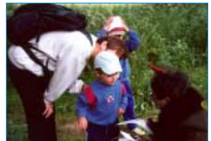
"No tak se mě přece neboj. Podívej, jsem malý jako ty. Malej, ale šikovnej!"

u Leontýnky a rytíře Brtníka z Brtníku. Vodníka a čerta by se děti možná i bály, jenže ti dva se více než strašení věnovali sporu, koho ze si krásná Eliška vybere za muže. V samotném závěru trasy přijali mušketýři děti do řádu rytířů a o podíl je zval k radovánkám velikánský hrad. Po zdolání celého dobrodružství by se mezi 230 dětmi určitě našlo několik, které by si rády vyzkoušely umění členů skupiny scénicko-historického šermu Charon.