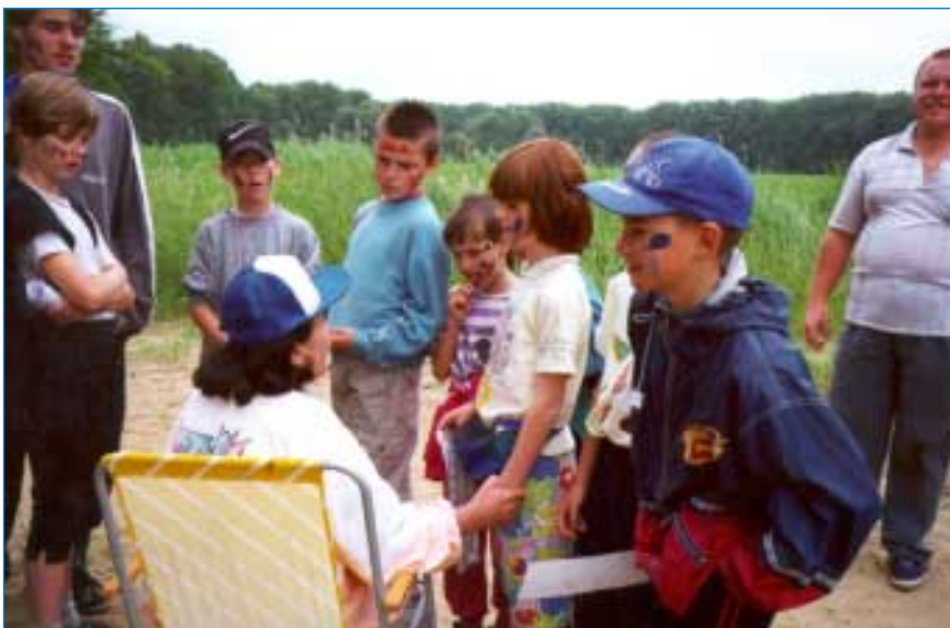
"A kdo ví, podle čeho si žabák vybírá žabku jako svou družku? Přece podle toho, která nejsilněji kváká!"

u Leontýnky a rytíře Brtníka z Brtníku. Vodníka a čerta by se děti možná i bály, jenže ti dva se více než strašení věnovali sporu, koho ze si krásná Eliška vybere za muže. V samotném závěru trasy přijali mušketýři děti do řádu rytířů a o podíl je zval k radovánkám velikánský hrad. Po zdolání celého dobrodružství by se mezi 230 dětmi určitě našlo několik, které by si rády vyzkoušely umění členů skupiny scénicko-historického šermu Charon.