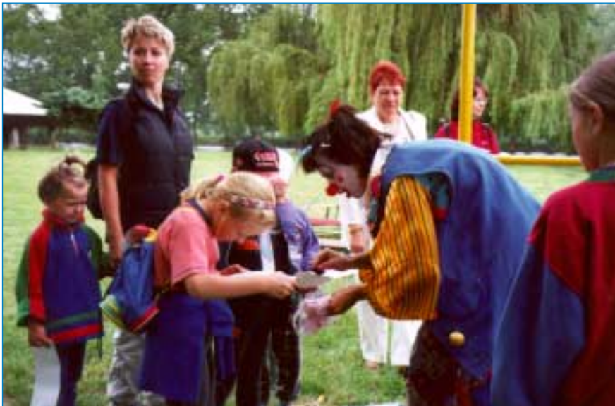
Cirkusový klaun byl první zastávkou a také to nejvládnější, co jste mohli na břehu vody potkat