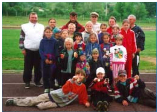
Napajedelská výprava po úspěšných lehkootletických závodech v Bzenci.