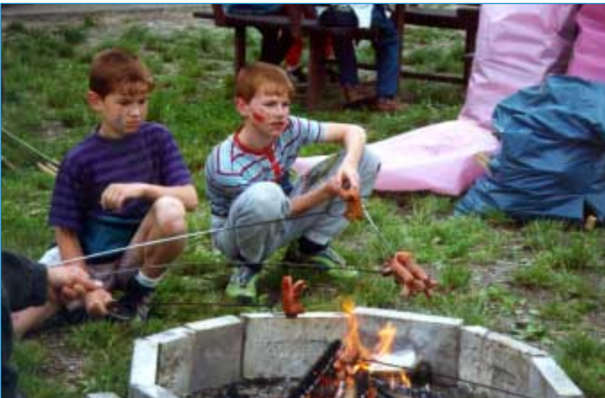
Vlastnoručně opečený špekáček chutná vždycky a po "Velkém filmovém dobrodružství" tím víc.