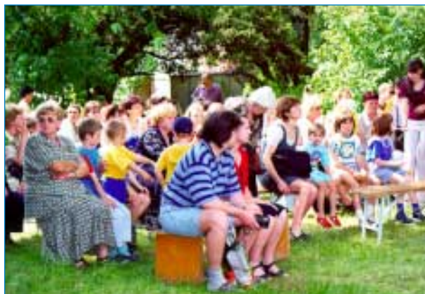
Pozdní přichozí už si nesedli.