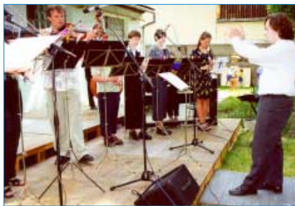
Hrajeme spolu - učitelé a žáci.