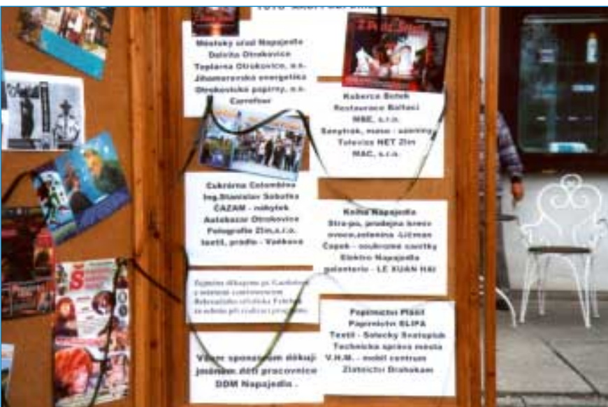
A nakonec si přečtete, kdo za to všechno "může". Jako první zejména poslední uvedení - Dům dětí a mládeže s komparem dobrovolných účinkujících.