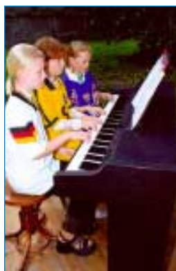
Více hlav více ví, více rukou více zahraje.