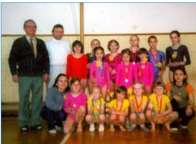
Družstvo mladých sportovních gymnastek, ověnčených medailami z přeboru Napajedel.