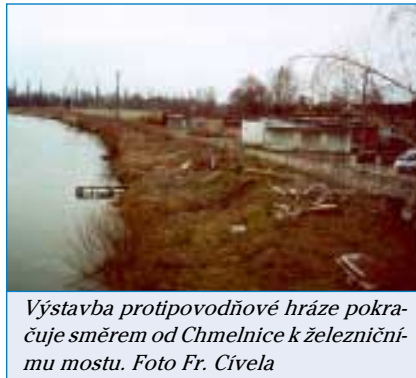
Výstavba protipovodňové hráze pokračuje směrem od Chmelnice k železničnímu mostu.

"První etapou bude zahájena rekonstrukce hospodářské školy, kde by měla v budoucnu najít své sídlo Základní umělecká škola R.