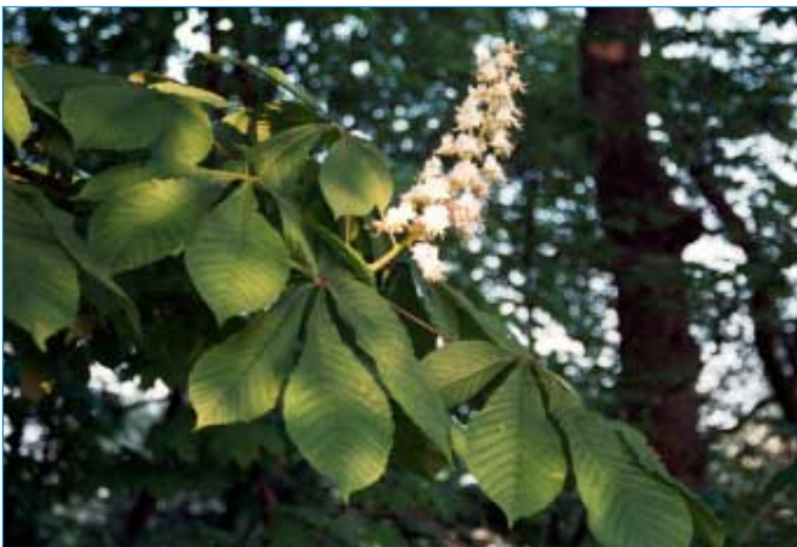
Po poměrně teplé zimě si jaro pospíšilo. Nevybouřená zima se však nechce vzdát své vlády a netrpělivé jaro krutě trestá. V odvěkém boji jaro nakonec vždy zvítězí, ale ne vždy odejde z boje bez šrámů. Lidstvo jako takové se s nimi dnes dokáže vypořádat, ale nádherná probouzející se země jej okouzluje stejně jako před tisíci let.