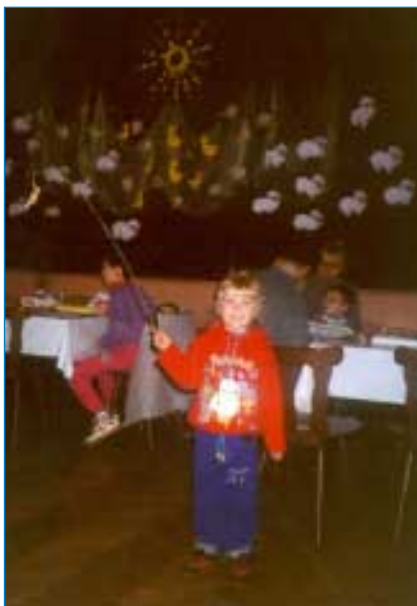
Na deštivé nedělní počasí malé šikulky, ale i šikulkové, zapoměli díky krásné jarně vyzdobené velikonoční dílně v sále Sokolovny. Tady si mohli kluci uplést pomlázku, děvčata nazdobit vajíčko, vyrobit ptáčka ze šustí, ale také si zasoutěžit nebo se vydovádět v tělocvičně.

◆ Ačkoliv do září je v dubnu poměrně daleko, dovolujeme si již teď upozornit napajedelskou veřejnost, že právě na první podzimní měsíc připravuje Muzejní klub Napajedla ve spolupráci s TJ Sokol výstavu o historii napajedelského Sokola. Především však zdvořile žádáme všechny Sokoly, jejich příznivce a rodiny, jakož všechny obča-