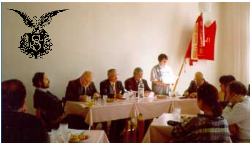
Pohledem na pracovní předsednictvo se vracíme k valné hromadě napajedelských Sokolů, o které jsme podrobně psali v předcházejícím vydání našich novin.