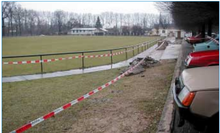
Pachatele, kteří poničili část zidky u fotbalového hřiště, nehledala policie dlouho. Vlastně je měli dříve, než předseda napajedelského fotbalového klubu přišel nahlásit škodu. Mezi oběma účastníky došlo k dohodě a vedení klubu přistoupilo na nápravu škody. Rozebrání zidky a její znovupostavení se odhaduje na pár desítek tisíc korun. Parta tří mladíků dostala šanci poněkud snížit svou vinu (souhrnně tenkrát napáchali v Napajedlích škodu asi za sto tisíc korun) a současně přemýšlet, zda si to příště raději neodpustí. -vb-